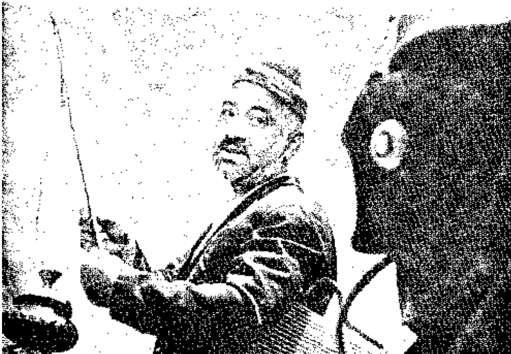
بالا : چشمه ساخته آریی اواسمیان مقابل : درشکلهچی ساخته نصرت کریمی