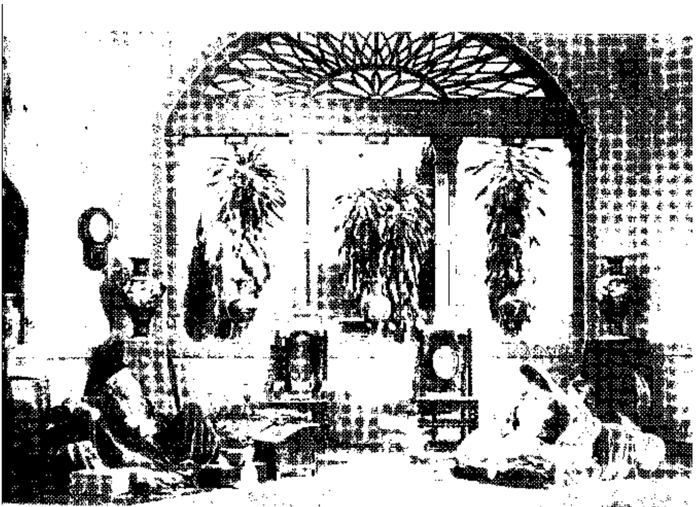
صحنه‌ای از فیلم دختر تر ساخته عبدالحسین سینتا