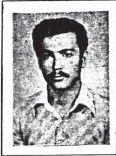
کمونیست پیکارگر رفیق شهرا منجاب، شیرباران بدست رژیم جمهوری اسلامی