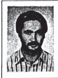
کمونیست پیکارگر رفیق کا میار، شیرباران بدست رژیم جمهوری اسلامی