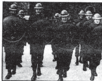
پلیس وین به مقابله دانشجویان کمونست آمده است

تجمع کردند تنها سه نفر خبرنگار به سفارت مراجعه کرده هنگام ترک آنجا با دانشجویان مبارز نیز مواجه گردیدند این فعالیت افشاگرانه چند نفر هواداران جریان ضد انقلابی رنجبریا شعار "نه آمریکا، نه روسیه، ایران مال ایرانیه" به مقابل سفارت آمده بودند و قدم خرا بکاری در مبارزه دانشجویان رزمنده داشتند که زوزه شان در فریادهای رسای دانشجویان انقلابی خفه شد.