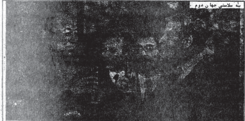
به سلامتی جهان دوم

(۳) - راجع به چگونگی عملکرد این بنگاه‌ها، از آلبانی امروز شماره ۵ (۲۸) سال ۱۹۷۹، بهره‌برداری شده است.