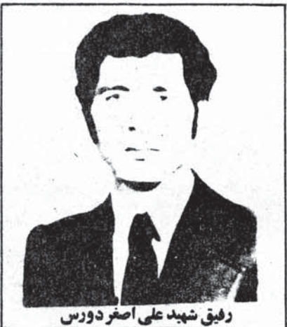
رفیق شهید علی اصغر دورس