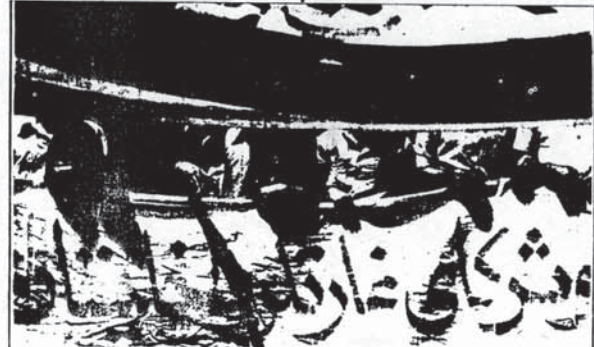
مرگ بر امیرا لیم و شرکای غارتگر داهلیان! اینست خواست طبقه کارگر در مبارزات دموکراتیک و خاد امیرا لیستی اش.

اثرات طبیعی این وضعیت مانند هر جامعه سرمایه داری وابسته دیگر، بتدریج و افزون بخران افتخا می بود. با این بحران در درجه اول بر دوش کارگران و سایر زحمت - کشان، او بود. گشتن سیوع ملیبارد، سوتان را با با لا، بزود، قیمت اجناس، اضافه نکردن سیوع دستمزدها زحمتکشان، خسار کردن سرمایه داران زکتور، بریا خوری و دزدی... تا سیم می کردند. احتکار، بورس بازی و بروری زمین، بریا خوری، شدت افزایش یافت و بیشتر از همه از این وضع کارگران و سایر زحمتکشان در عذاب بودند. ردمراطی داری وابسته، تا بودی اثرات نورد اواز خود داشت. هر چه سرمایه داری وابسته ردمراطی کرده بود، نتایج فکات و نتایج دهای درونی آن بار بیشتر حرا در میشد. ما لیا فقر و محرومست توده ها، ما لیا زسیدترین طبقه فقرا نیسا - دیکتا خوریه بودن، وضع افتخا اقتصادی توده های زحمتکش، همه و همه توده های ستم عملیات خادتر علیه رژیمتای سوسی می داد. افزایش ۵۵ اعتبارات و اعتبارات کارگران در شکل خادتری "دوای زه" و ج گرفت. مدها کار - خانه و هزاران کارگری را افراش دستبرد، با لا بردن میزان سود ویژه، حق منک، افزایش حق اولاد، افزایش مزایای کارگری و... اقداما اعتبار کردند. در این سالها نسبتا - سات کارگران بر آکنده و ما ساج افراش دستمزدها ردمطوری زد.