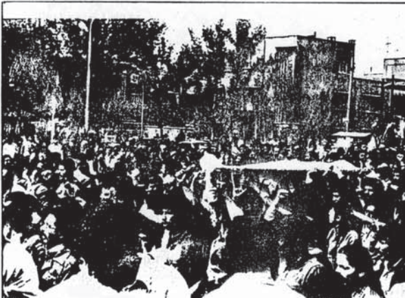
تشیع جنازه یکی از قهرمانان دانشگاه که با گلوله میا دارا ن به سفاک رسیده است - رمزه سفاکده عرض دوسه روز در ستان دانشجویان اینهمه کشتار نکیرد !

قادر بود "زست فدا" امیرا لسمی خود نکیرد، نهمی توانست به "فرم" دست بر ندهد می - توانست از کنترل برخی از نیروهای انقلابی برای تضعیف جبهه انقلاب سفاکد کند . در جا کنیک بورژوازی مدرنما می این تا کنیکها را در استین دارد. او از یکسو "فرمای کنها" و "فرما رخی" را مطرح می کند تا مرک محتوم سرما به داری وابسته را انا فرمها نشی جزئی به عقب بسندارد، از سوی دیگر "زست فدا" امیرا لسمی "خودمی" گردان مسار زات فدا میریا لسمی توده ها را در جرح و سبج متافع هیبت حاکمه منحرف سازد. ما ندرستی تا کنون چندین بار ما هبت نا کنیک های جدید حکومت را در مقالات مختلفی شرح کرده و محتوای واقعی آنرا کذطلع سلاج توده ها و سرکوب آتان می یابند، توضیح داده ایم. "دموکرات - مائشی" تا کنیک دیگر حکومت است که نمونه - های آنرا در ماههای گذشته خوسمی داده ایم. بنش می عقب بسندارد، از سوی دیگر مناظره فدا گرا نی را می پذیرد (۲)، از سوئی دا نتحوت کشتار می کند و از سوی دیگر در سلوسر یسون موام چریکهای فدا ش خلق را برای سرگ - داشت شهید ای اردیبهشت نشان داده میشود . ارکسودفا ترگروهی انقلابی در دانشگاهها تعطیل می شود از سوی دیگر "حاره داده می" شود و سیرون دفا تر خود را تشکیل دهد و برای