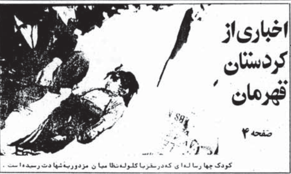
اخباری از کردستان قهرمان

● گزارشی از تهاجم فاشیستی عوامل ارتجاع به دانشگاههای شیراز، اهواز و سیستان و بلوچستان