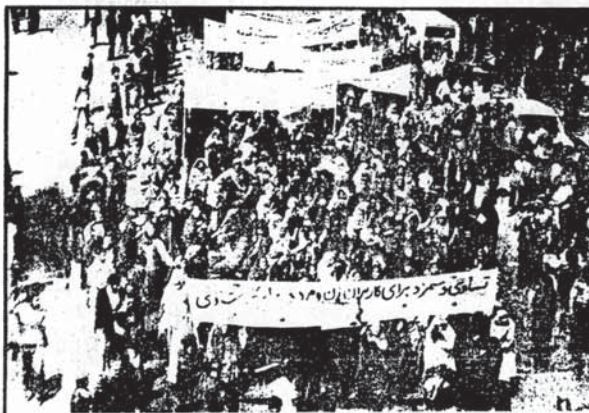
زنان کارگر در مقابل کارمندان دستمزدهای می خواهند. این یکی از خواسته های زنان کارگر در راهپیمایی سبکی اول ماه مه سال گذشته بود.

در تاریخ ۵۹/۱۲/۱۲ سه نفر نماینده اخراجی به نامهای شورا، معنی و حجاج نکاری توسط قدوسی دادستان کل انقلاب به تهران احضار می‌شوند. نمایندگان مذکور در تهران فرصتی می یابند تا بعدت نسیم ساعت با بنی مدرملقات و گفتگو کنند. آنها ضمن این ملاقات دربار، عملگردهای ارتجاعی معین فرحت کرده و خواستار منظره تلویزیونی با وی می‌شوند. بنی مدرملقا هر می‌باید مسئله اخراج بنوعی به تفویض می افتد. اما پس از زکشت نمایندگان به آبادان، حکم اخراج آنها عملاً به اجرا گذاشته می‌شود. چند روز بعداً این نمایندگان توسط دادستان کل به تهران احضار شده و پس از یک با زوجی کوتاه به زندان اوین فرستاده می‌شوند. حال اینها است که یکی از نمایندگان عنوان ضمن اعلامی صنعت نفت که همراهِ این سه نفر بوده نیز دستگیری زندانی میگردد. پس از این واقعه همکاران نمایندگان سبکی می کنند با بنی مدرملقات تا نمایند. اما وی حاضر به پذیرفتن آنها نشده و به این ترتیب نگار