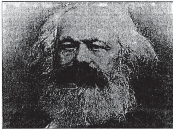
۱۴ دسامبر (۲۳ اسفند) ایراستات با نود و هجدهمین سالگرد درگذشت کارل مارکس. ما در شماره آینده مقاله ای به این مناسبت درج خواهیم کرد.

دومین میتینگ انتخاباتی سازمان چگونه برگزار شد؟