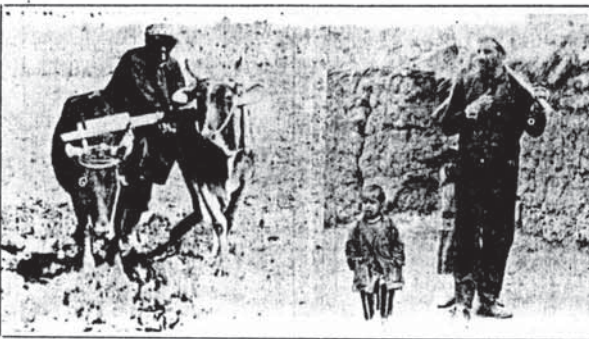
یکی از خصوصیات تاریخی سوزده ارضی در ایران بیوندن آن با فتووالی ایسم و

در جریان املاجات ارضی، مالکین با انواع روشها و اعمال نفوذ در دستگاه اداری توانستند ملاک مغلوب و سیمی را برای خود نگهدارند و در مقابل طغیان دهقانان شوه های عقب مانده به اشتراک دهقانان بپردازند. در نهایت ایخبر بسیاری از برای ارتش، سرورکرانها و زمین خوارانی که در دستگاه دولتی نفوذ داشتند، با تصرف اراضی دهقانان (که قسمتی از آنها در جریان املاجات ارضی به آنها نواکدار شده بود) به زور و با پشتیبانی نیروهای سرکوبگر به ایجاد اراضی وسیع مکانیزه و اشتراک دهقانان تهدیدت و کارگران روستائی برداشتند. از طرف دیگر دولت فدا خلقی با بیرون راکسندن انضوی ارددهقانان از ازارای شان که در زیر سدها واقع بود، این اراضی را به سبکی بسیاری رانل همرا با خدمات آبرسانی و سق و شیره که تقریباً معانی تمام میشده سرکوب های کشت و صنعت فارچی و سرمایه داران واسه آگاهی می داد، شرکت های سهامی زراعی نیز بهین ترتیب تشکیل می گردید. این جریانات سلب مالکیت که نوا مهابدا و جنبش نهترین سرکوب و قلع و قمع دهقانان و سرکوب کردن منافع توده مالکان جز انجام میگرفت، توده های خلق بدست دهقانان را در نفاط دندی با سرورکرانی و سرمایه داران ارضی وابسته و زمینداران بزرگ قرارداد دولتی این سر عهده انقلاب دموکراتیک نهاد امیرالایسمی قرار داد.