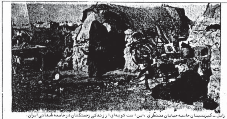
زابل - کبرستان حاسه حایان منطری، این است کوبه ای از زندگی زحمتگزاران در جامعه طبقاتی ایران.

همانطور که از این نمودار دیده می شود هرچه جمعیت بیشتر می شود، درآمد مدبرانه کاهش پیدا می کند. بالعکس هرچه جمعیت گروه اجتماعی کاهش پیدا می کند، درآمد آن بیشتر است. که بخوبی اختلاف بین اقسا طبقات را نشان می دهد. برای اینکه ببینیم این اختلاف طبقاتی در سالهای مختلف چگونه بوده و به چه صورتی درآمد شده