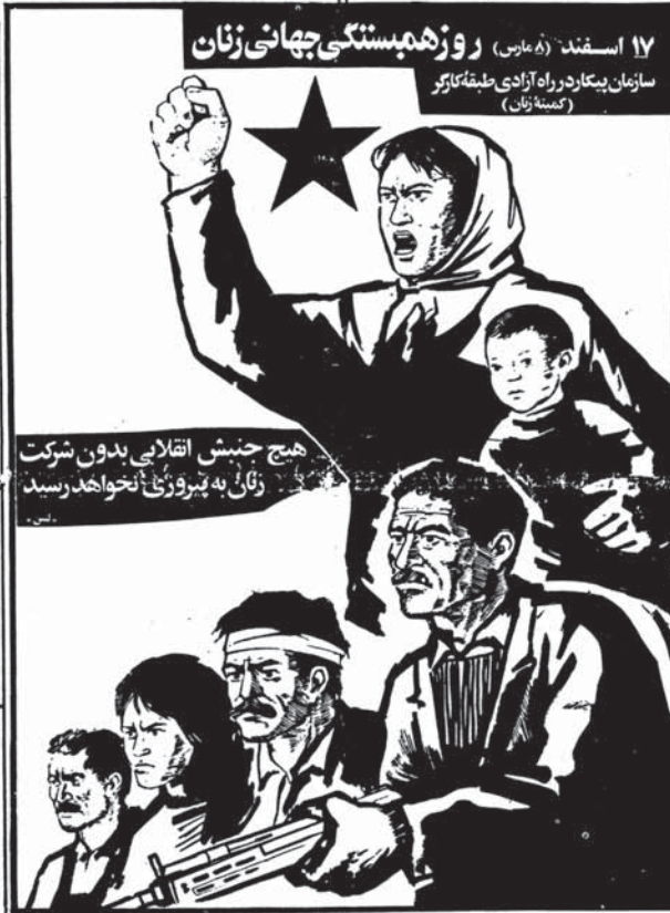
۱۷ اسفند (۸ مارس) روز همبستگی جهانی زنان سازمان بیکار در راه آزادی طبقه کارگر (گمنگان)

در آستانه ۸ مارس (۱۷ اسفند) روز بین المللی همبستگی زنان، دعوت کمیته زنان سازمان بیکار در راه آزادی طبقه کارگر روز بیستم ۱۶ اسفند میتیگی در دانشگاه ملی تنکس تهران برگزار شد. سالن با عنکبوتی ۱۵ تن از شهدای زن سخنرانی کردند. م. ج. ۱۰ و نیز بلاک ردها و طرحها و پوسترهایی رسیا شد. در تحلیل از مقام زن و در حمایت از نسبه در صفحه ۹