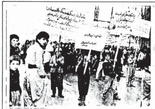
در این مراسم راجع به تشکیل نهاد مشترک در سطح محترم شد، که در شمار ۲۵۰ پیکار به مواضع حوزه مفرد در آن مورد اشاره گردیدیم و در اینجا بدین ترتیب اعلام میکنیم - در خانه مراسم شماری خوانده اند و سپس یکی از رفقای پیکار تحریرات و جنگجویی تشکیل جلسه های مفاد و متراجمندگرتند.

در زمینه جنبشهای انقلابی - ملی خلقهای گرد و در ترکیب او با داری کرده که این جنبشها جزی جزا در مقام نیست، فقام بدلیل عدم رهبری آن از جانب طبقه کارگر و سنجیده افسان قدرت بدست از کارگران و مشروطه خواهان دسروری با شما مانده و امروز ما ادامه آن را نکال کونا کون هستیم.