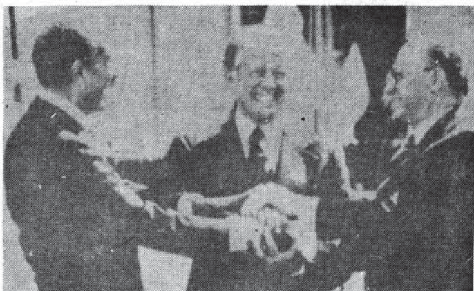
در حال توطئه بر علیه خلق عرب و انقلاب فلسطین

۷- در ۱۹۵۵ پس از انعقاد قرارداد کنسرسیوم با