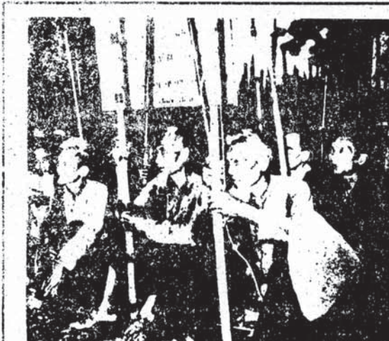
بیر مردان ویتنامی آمده نبرد با امپریالیسم آمریکا: خلق ما نیز چنین خواهد کرد

خلقهای ایران در این مرحله از مبارزه، ضعیفند امپریالیستی خود لحظات حساسی را از سر می گذرانند. امپریالیسم آمریکا در قیام مهمن ماه هکتگ نما سوسی حامیان و خیانتکاران و مبارزکاران داخلی و بیگانه بقیه در صفحه ۲