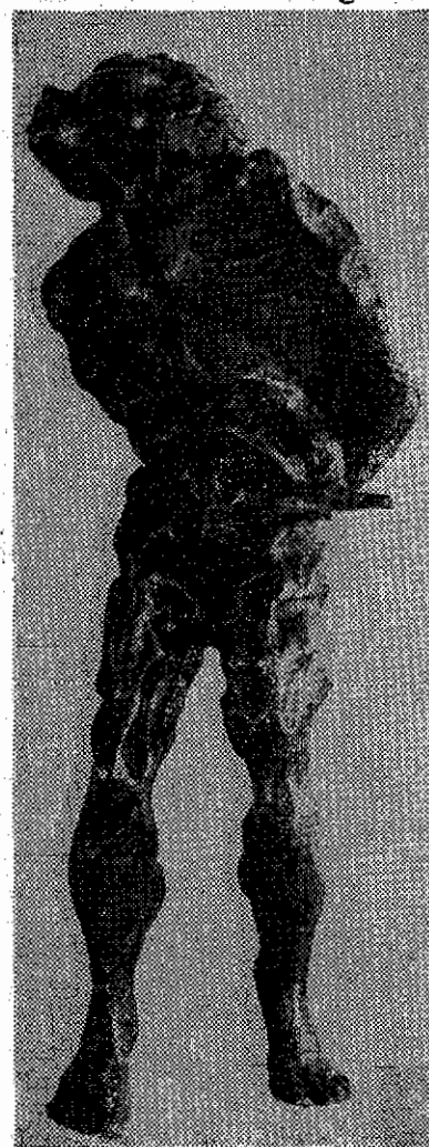
تندیس بیادبود خسرو روزبه

مراسم پرده برداری از تندیس بیاد بود خسرو روزبه صبح روز ۲۳ اکتبر (اول آبانماه) هیئت