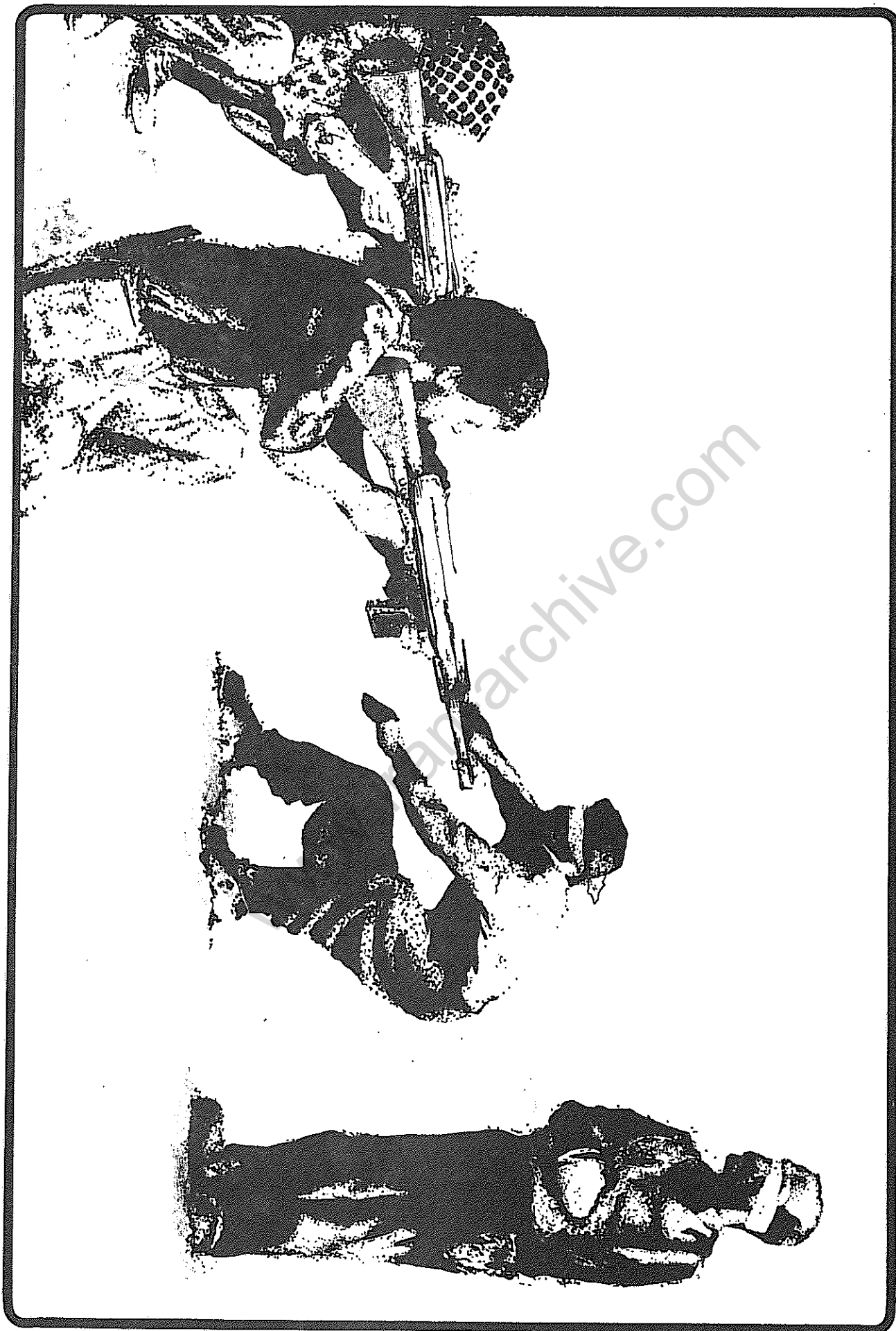
تهیه و تنظیم از : تشکل هواداران " سازمان چریکهای فدائیی خلق ایران " - هلند