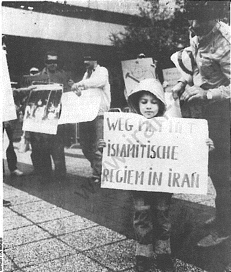
De Iraniërs die twee weken geleden de Iraanse ambassade hadden bezet, moesten woensdag voorkomen voor de Haagse rechtbank. Voor de rechtbank een actie van de sympathisanten van de Iraanse Guerrilla Organisatie Volksfedayin (IGOV) die protesteerden tegen het islamitische regime in Iran. De Iraniërs zitten voorlopig nog dertig dagen in arrest.

ایرانیانی که دو هفته پیش سفارت ایسرا را اشغال کرد و بعد در روز چهارشنبه ( ۱۰ اکتبر ) در شهر " دن هاخ " ( لاهه ) در دادگاه حضور یافتند. ایرانیان همکار " سازمان چریکهای فدایی خلق ایران " که در جلوی دادگاه حضور یافته بودند با آکسیون خود رژیم خمینی را محکوم کردند. ایرانیان اشغال کنند سفارت ۳۰ روز است که در بازداشت بسر می برند.