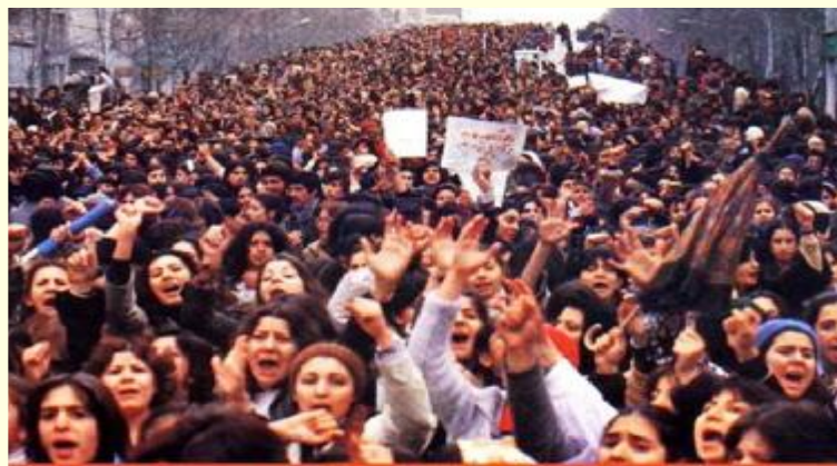
International Women's day demonstrators Tehran, March 8, 1979