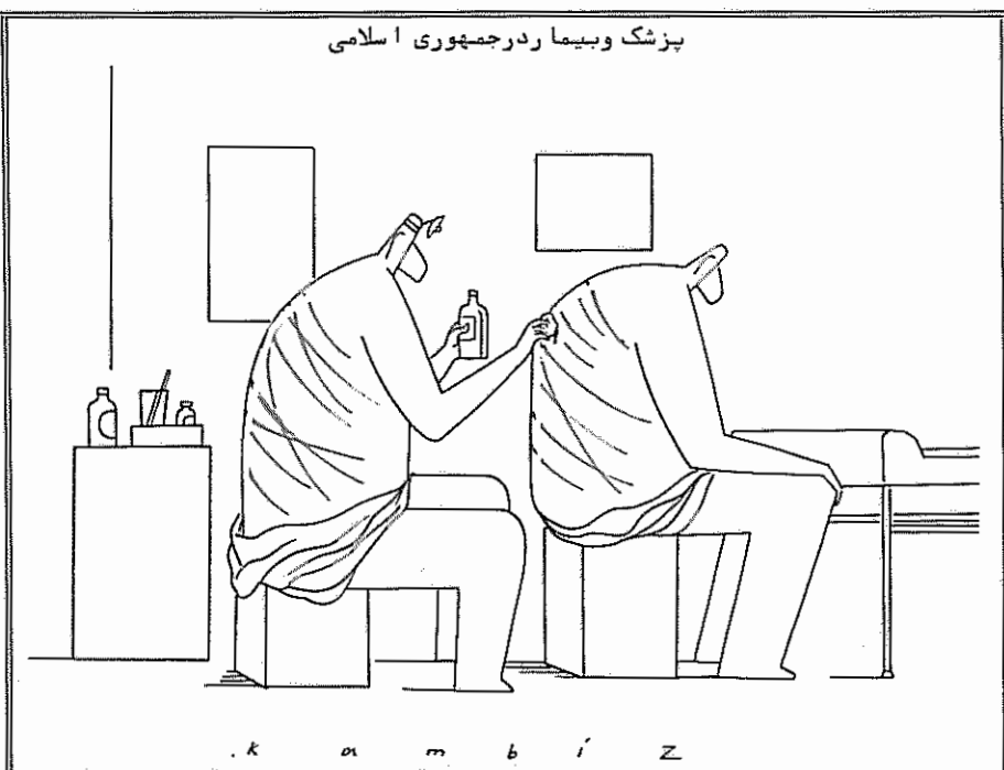
پزشک و بیمار در جمهوری اسلامی

بمناسبت هشتاد و دومین سالروز اسلام مشروطیت، ایرانیان مقیم لس آنجلس با مداد سه شنبه ۱۴ مرداد - ۵ اوت - در برابر ساختمان بانک ملی ایران، گرد آمدند و ضمن گرامیداشت هشتاد و دومین سالروز مشروطیت، از حرکت های اعتراض آمیز اخیر پریشان ایرانی در برابر رژیم اسلامی پشتیبانی بعمل آوردند. تظار کنندگان که پرچم شیروخورشید نشان ایران و پلاکاردهای با شعارهایی به طرفداران ازحاکمیت ملی و درخواست آزادی سریع پزشکان زندانی در جمهوری اسلامی با خود حمل می کردند، سپس در خیابان های شهر راهپیمایی کردند و صدای اعتراض خود را به گوش هزاران تن از مردم کوچه و بازار که شاهد این تظاهرات بودند، رساندند. بر پلاکاردهای تظار کنندگان این شعارها به چشم خورد: "ما برای استقرار دیمکراسی در ایران مبارزه می کنیم" - "حقوق بشر استثناء پذیر نیست" - "ایران هرگز نخواهد مرد" - "از شکنجه پزشکان ایران که در راه احقاق حقوق صنفی خود مبارزه می کنند، جلوگیری کنید" - "مرگ بر خمینی و جمهوری اسلامی، زنده باد مردم ایران، برقرار بباد رژیم مشروطه". کانال هفت تلویزیون آمریکا که از این تظاهرات فیلم برداری کرده بود، صاحب پرداخت. گزارش تلویزیون کانال هفت، در برنامۀ خبری شب همان روز پخش گردید.