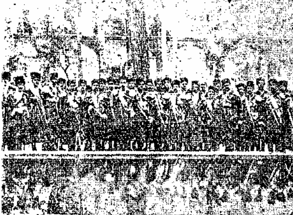
سردار ستاروسلسکی و عهدی از افسران قزاقخانه

بدین ترتیب نگرانی انگلیسی ها از جانب افسران روسی لشکر قزاق تا اندازه ای مرتفع شد . بعد از این قضیه افسران روسی تحت سرپرستی سرهنگ ستاروسلسکی وسبأ مخالفت خود را با حکومت انقلابی و کمونیستی بسپو بر اوین نماینده حکومت انقلابی روسیه اطلاع دادند و این مسأله سبب شد که بر اوین یاد داشتی بوزارت امور خارجه ایران فرستاد که این افسران با آنکه در خدمت کشور بیخرف ایرانند در مسائل سیاسی دخالت میکنند و تقاضای انفصال و اخراج آنها را سکوره بود (۱)