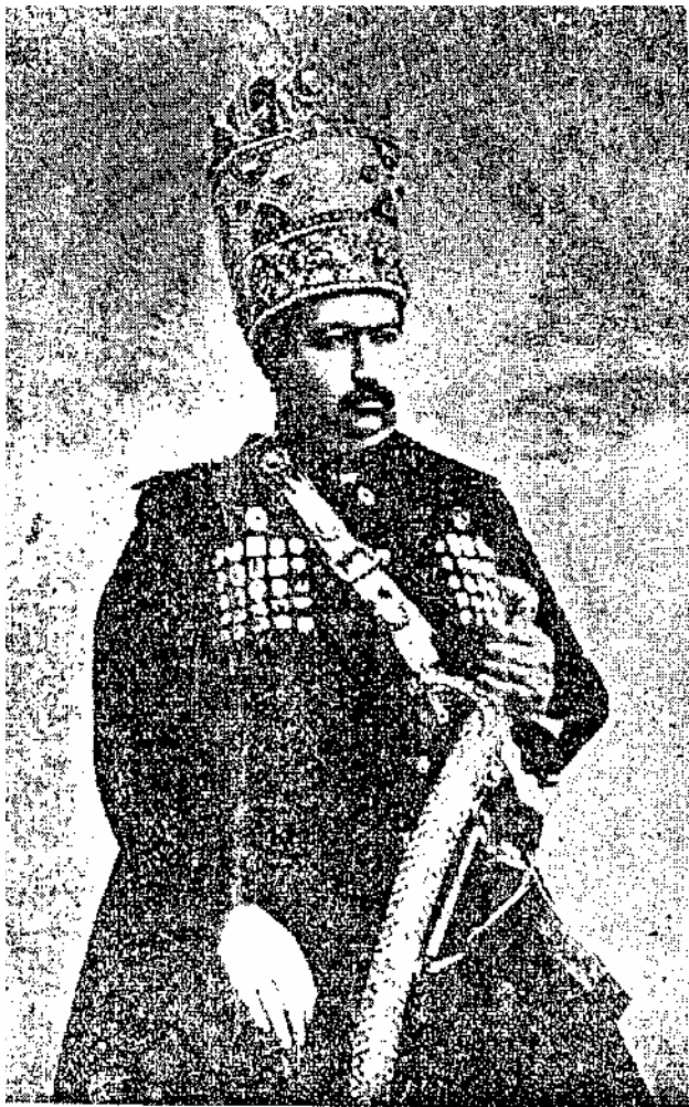
محمد علی شاه

چند روز پس از این نوسه سازمان که در بریگاد قزاق روی داده، انقلاب ۱۰ ژوئن در طهران بیش آمد ولی قبل از آنکه بتواند قوامی بگیرد مجلس بفرمان انصران بریگاد قزاق تبویب شده شد و با تریها و مسلماهای بریگاد مجلس و ملیون متهم و مطلوب شده (۱) حکومت نظامی برقرار و کلنل لیاخوف فرمانده بریگاد حاکم نظامی طهران شد. باین ترتیب شاه مستبد بانکاه روسها بر ملیون که بوسیله سیاست انگلیسیها تقویت میشدند فائق آمد و با بیادرت دیگر باید گفت که امپراطوری انگلستان در صحنه سیاست و قاضی متلوب گردید.