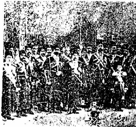
احمد شاه دولای ژنرال قزاق لیاخوف و هدای از انصران قزاقخانه

این شجاعت و فداکاری های بریگاد قزاق و انصران روسی آن که موفق شدند با تصرف بیتن مجلس ملی ایران خدمت شاه سبب میکنند در قبال آن مصالح این بطوری روسیه و سایرین محفوظ نمایند سبب شد که بریگاد قزاق و انصران روسی آن مورد توجه و مراسم شاه واقع شوند و همین لحاظ هم بود که لیاخوف دو ماه اوت ۱۹۰۸ (۱۳۲۶ قمری) موفق