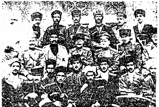
افسران روسی تزارخانه و رضاشاهان سرهنگ

این است که انگلیسی ها بفکر افتادند بهر نحو هست خاطر خود را از جانب سازمان قزاق آسوده کنند و چون اقدامات هیأت اهرامی در باره انحلال این سازمان بجای نرسیده بود تاگزیر دو صمد بر آمده که لائزل سازمان قزاق را بدست بکنند افسر ضد کمونیسم بسپرد تا بیه فرصتی بدست آید و شاید بتواند بساط سازمان قزاق را از ایران براندازند ولی اجرای این فکر هم اجباب میکرد که زیر پای سرهنگ کلوزه را جاروب کنند