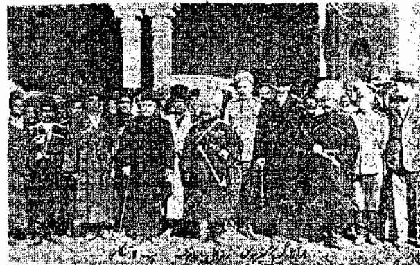
سیهالار و ژنرال باراتوف و سفیر روسیه در طهران

با این نعر پیشنهاد سرهنگ او شاکف که از سال ۱۹۱۳ مؤثراً فرماندهی بریگاد مرکزی مأمور شده بود مبنی بر اینکه هنگامی هفتصد نفری از قزاق در دست کرمانشاهان و مشهد تشکیل گردد ولی دولت ایران با آن موافقت نکرده بود ، تأیید میشد و رفته رفته جامعه عمل بغور بیوشید .