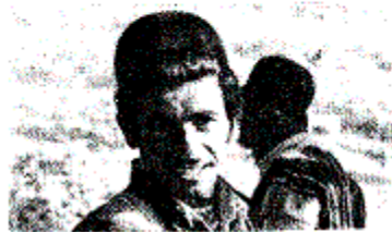
(ویژه‌نامه ایل بختیاری)

■ مدیر مسئول و سردبیر: هادی سیف ■ دستیار و مسئول امور داخلی: محمدآولیائی ■ طرح و میزبانی: شهرام شهمیری ■ روی جلد: عباس سارنج ■ فرهنگسرای نیاوران وابسته به بنیاد فرهنگ و هنر ایران ■ تهران انتهای خیابان پاسداران، روبروی پارک نیاوران بخش نشریات ■ ماهنامه نامه نور شماره هشتم و نهم خرداد ماه ۱۳۵۹ ■ تلفن: ۲-۲۸۷۰۸۱