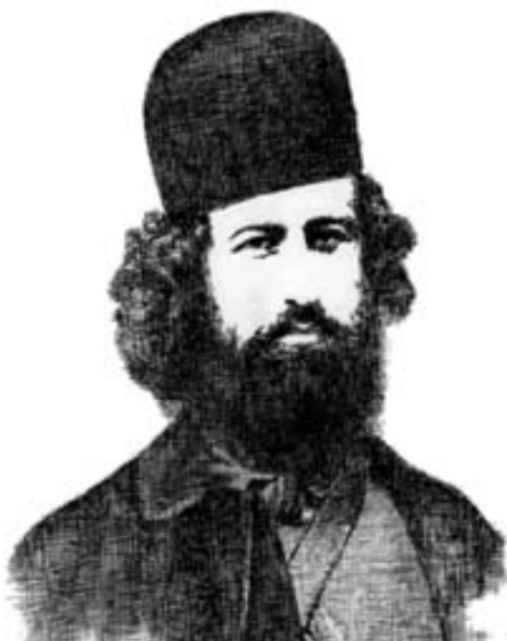
عکس کتاب قابل رویت نبود و این بجایش آمد

در خلال این احوال بین خالوقربان و میرزا کوچک خان برای تحویل گرفتن هاله رشت نزاع میشود و متعاقب آنها عمواغلی در رشت معقول میگردد