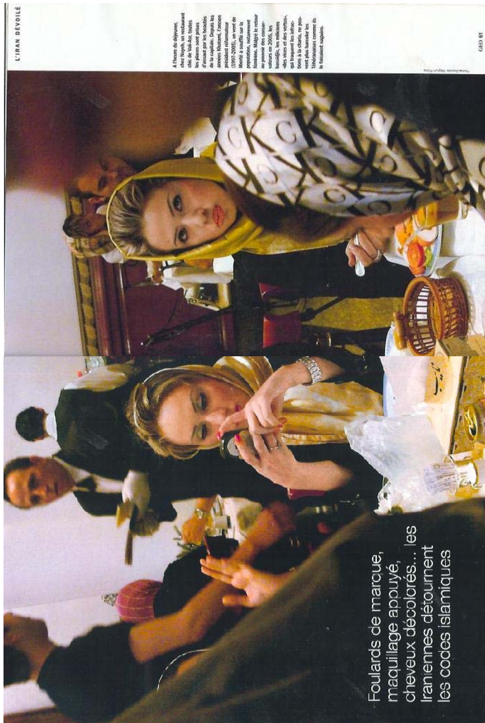
Foulards de marque, maquillage appuyé, cheveux décolorés... les Iraniennes détournent les codes islamiques