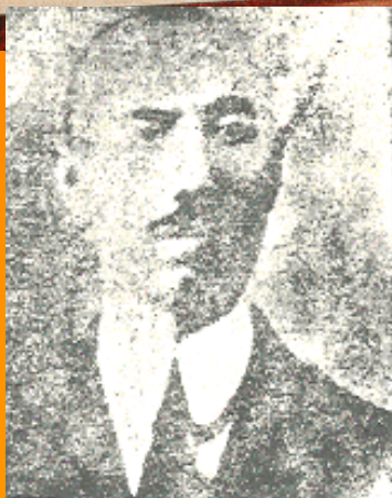
حیدرخان عمو اوغلی از رهبران خردمند انقلاب ایران