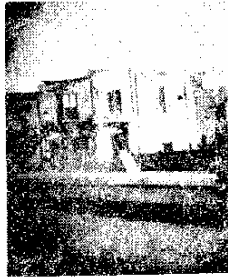
سه راه آکبائیان - سر تخت بر برهیا محل انداختن بمب محمد علی میرزا

چون سندی و اقراری بدخالت آنها در موضوع بمب بدست