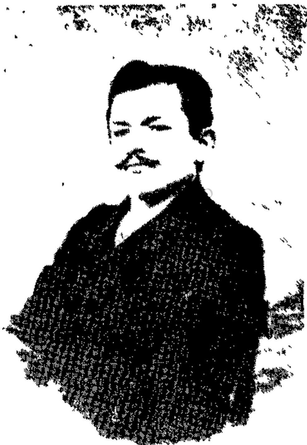
موسی خان بهادر السلطنه

کمکی تهران بسرکردگی غلامحسین خان سردار محتشم و جعفرقلیخان سردار بهادر و پیرمخان در همین موقع رسیدند و از طرف دیگر دشمن را بیاد گلوله شصت تیر گرفتند.