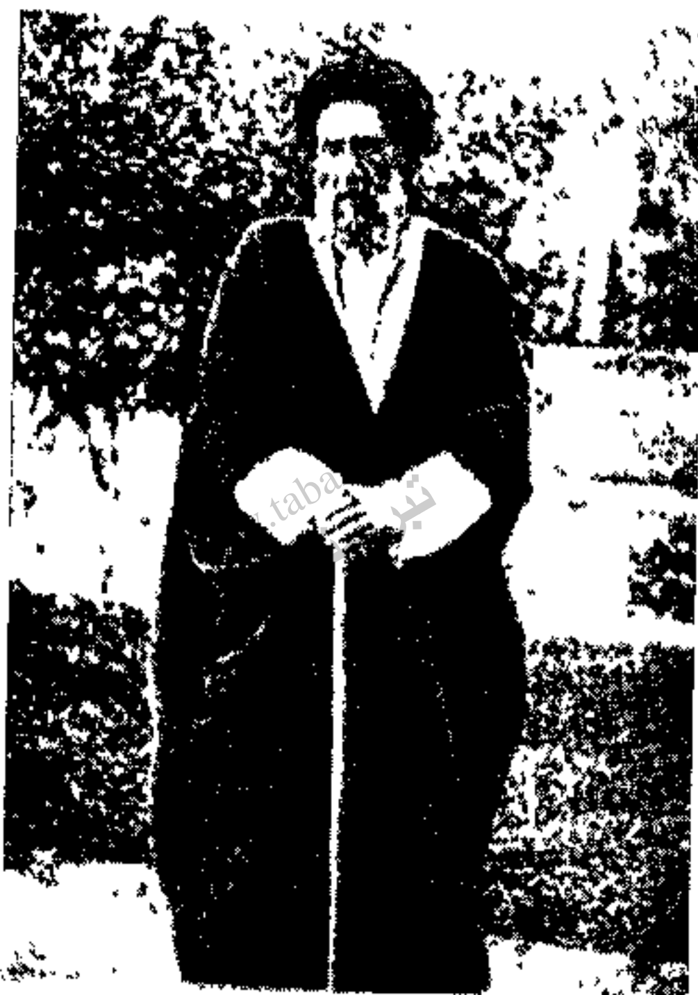
مرحوم سید حسن مدرس

روز سوم اسفند از شاهرضا حرکت و شب را در مهیار توقف کرده روز بعد وارد اصفهان شدیم. خوانین مستقیماً بعمارت حکومتی رفتند و عده‌ای نیز در باغ سردار ظفر واقع در چهارباغ که فعلاً محل اداره