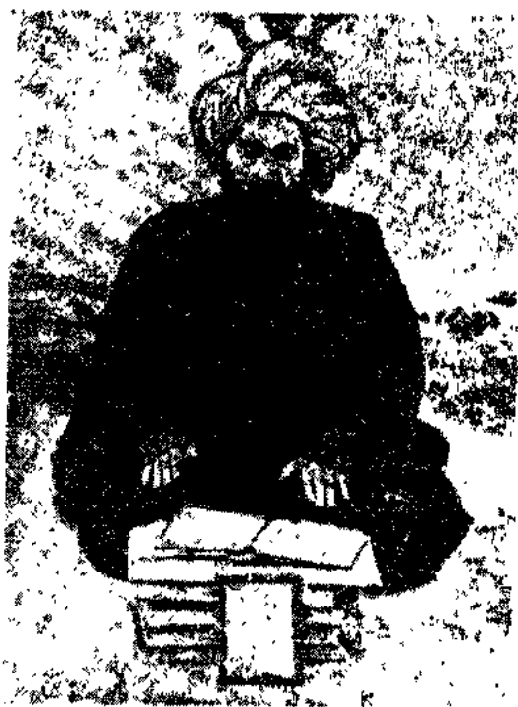
مرحوم شیخ محمد تقی آفانجی

السلطنه اظهار امتنان بعمل آمده تذکر داده شده بود که پس از جراحی چشم وضع مزاجی رو به بهبود است . هر دو نامه را با قامیرزا پسر شیخ الاسلام تسلیم نموده دستور دادند