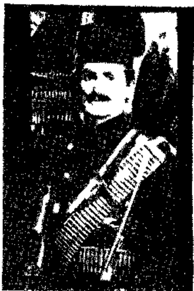
مرحوم محمد رضا خان سردار فاتح

چشمان او را بست و سایرین شلیک کردند . محکوم بیچاره در دم جان