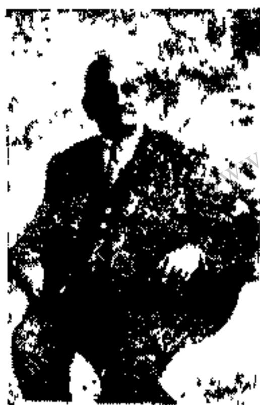
حاج خسرو خان سردار ظفر و بختیاری

در این موقع صمصام السلطنه بحکم محمد علیشاه از حکومت بختیاری منفصل و سردار ظفر بسمت ایلیخانی منصوب شده بود. دکتر