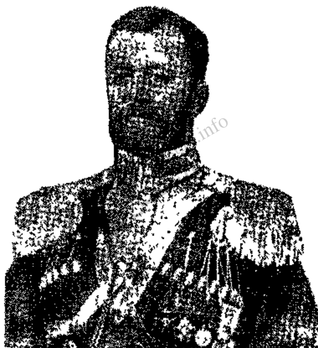
کمانل لیاخوف روسی فرمانده بریگاد قزاقی

روز چهارم محاصره قزاقخانه ، لیاخوف روسی فرمانده بریگاد قزاق شخصاً بعمارت مسعودیه رفت و شمشیر خود را از کمر باز کرده