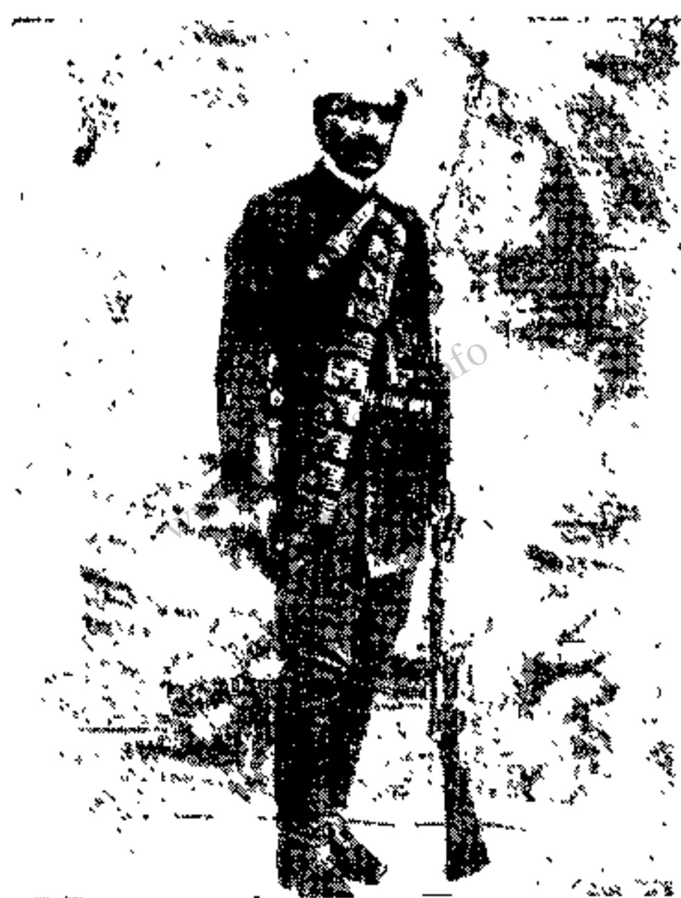
فتحعلیخان بختيار (سردار معظم)

در ماه جمادی الاول ۱۳۳۰ قمری سالارالدوله از طرف کرستان باتفاق داود خان کلهر و رؤسای ایلات غرب بشهر سنندج که حکومت آن با عبدالحسین میرزا فرمانفرما بود حمله برد. چون فرمانفرما قوای مکفی نداشت سنندج را تخلیه کرد و عازم کرمانشاه شد و فقط دو عراده