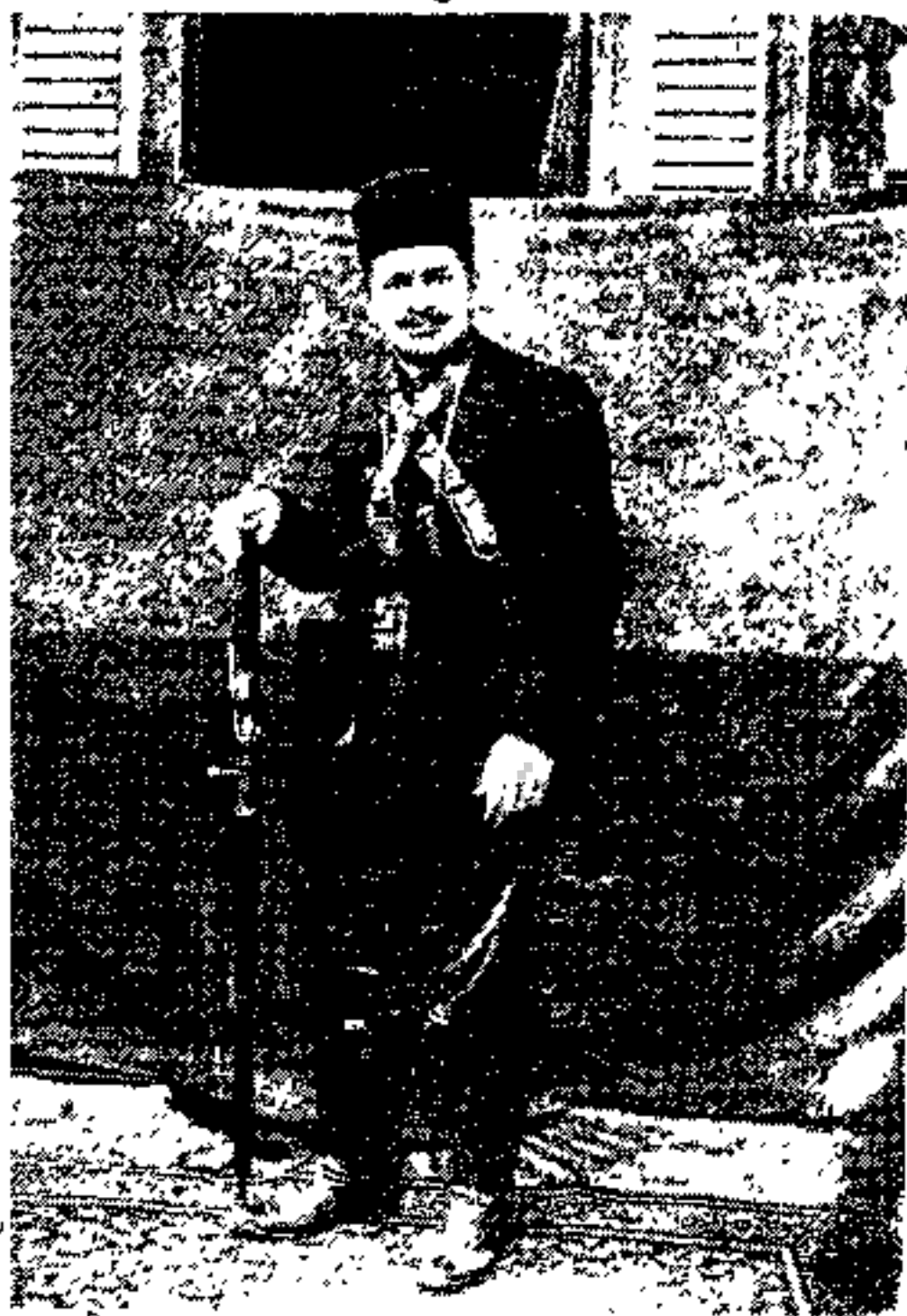
مرحوم حاج سلطانعلیخان شهاب السطنه بختیاری

مخالفت او برقرار است که اینک برای خوانندگان عزیز شرح داده میشود : پس از قتل پیرم خان و برقراری گریش بجای او متدرجاً نظم