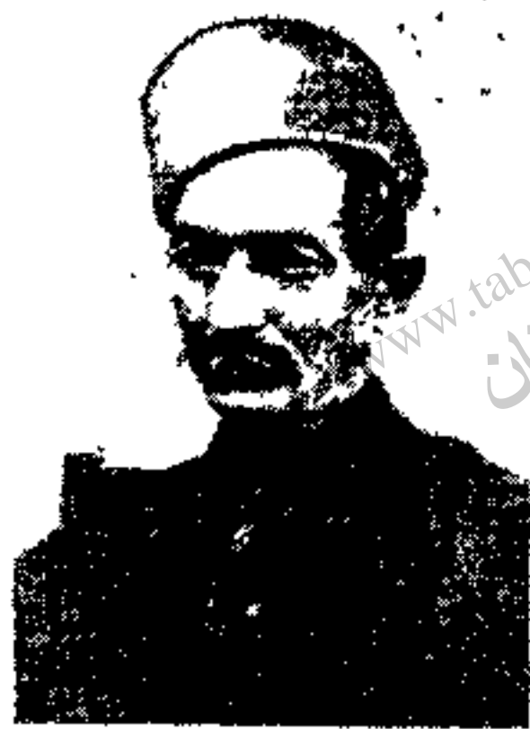
عارف شاعر ملی ایران

ساخت و منتشر کرد . پس از انتشار این تصنیف مأمورین نظمیه بدستور ناصر الملک در صدد دستگیری عارف برآمدند ولی او از مهر که گریخت و کار آگاهان شهربانی نتوانستند محل اختفای او را پیدا کنند .