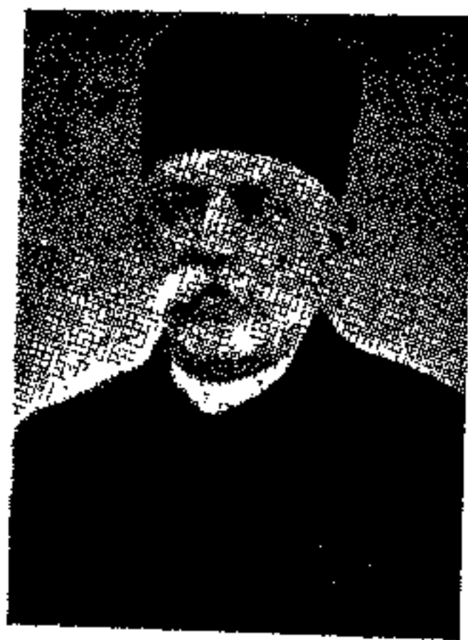
عبدالحسین میرزا فرمانفرما

خلاصه پس از مشاهده جنازه یار محمد خان، با کسب اجازه وارد