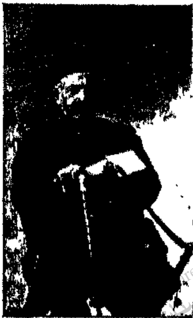
محمد ولی خان سپهسالار تنکابنی

در همین اوقات خبر رسید محمد ولی خان سپهسالار تنکابنی که