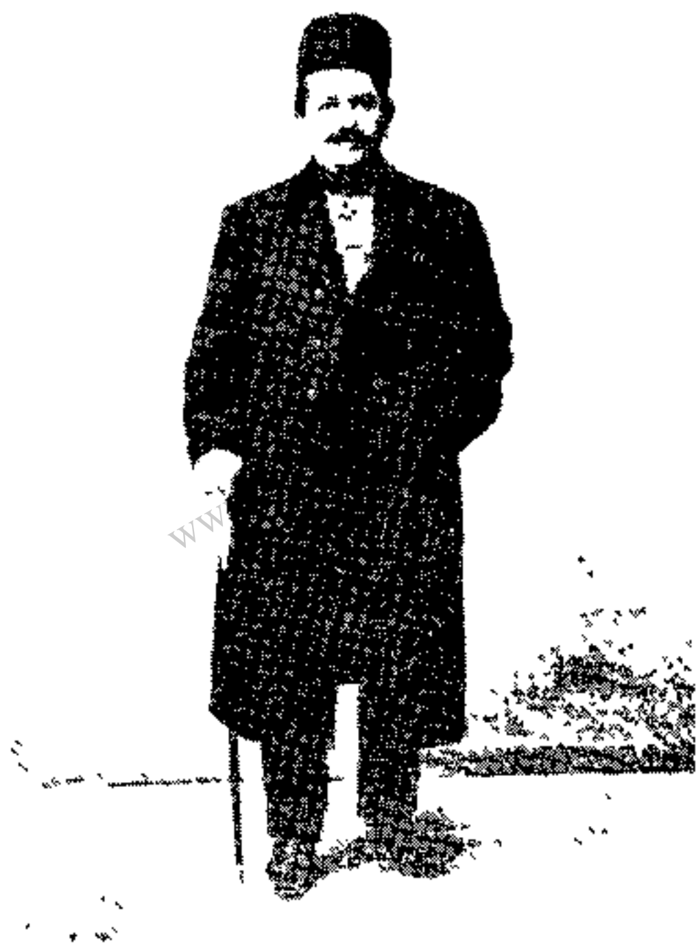
شادروان سلطان محمدخان سردار اشجع

پس از چند روز هزار و سیصد سوار بختیاری که مقدمه الجیش اردو را تشکیل می دادند وارد قم شده از آنجا راه ساوه را پیش گرفتند. ننگارنده هم چون جزو سواران بختیاری در اصفهان بودم بنا