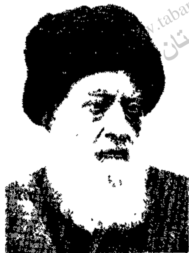
بهشتی روان سید محمد طباطبائی پیشوای بزرگ مشروطه

نمایندگان دولتین روس و انگلیس ضمن مذاکره با خوانین بختیاری متذکر شدند که هر گاه اردوی مجاهدین از راهی که آمده مراجعت نماید آنها متعهد خواهند شد که محمد علی میرزا را به همراهی جدی با برقراری رژیم مشروطیت و ادار نمایند و انجام این مسئله را تضمین خواهند کرد ولی مصمصام السلطنه و سردار اسعد در جواب گفتند که چون عرایض ملت به خاکپای مبارک اعلیحضرت همایونی نرسیده و درباریان خائن شکاف عمیقی بین شاه و ملت ایجاد کرده اند لذا ناگزیر ما برای تقدیم تقاضای حضوری خود بطهران خواهیم رفت و مسام است که در غیر این صورت باز هم شاه بتحریک درباریان بقول خود وفان خواهد کرد و به حیثیت دولتین نیز لطمه وارد خواهد شد .