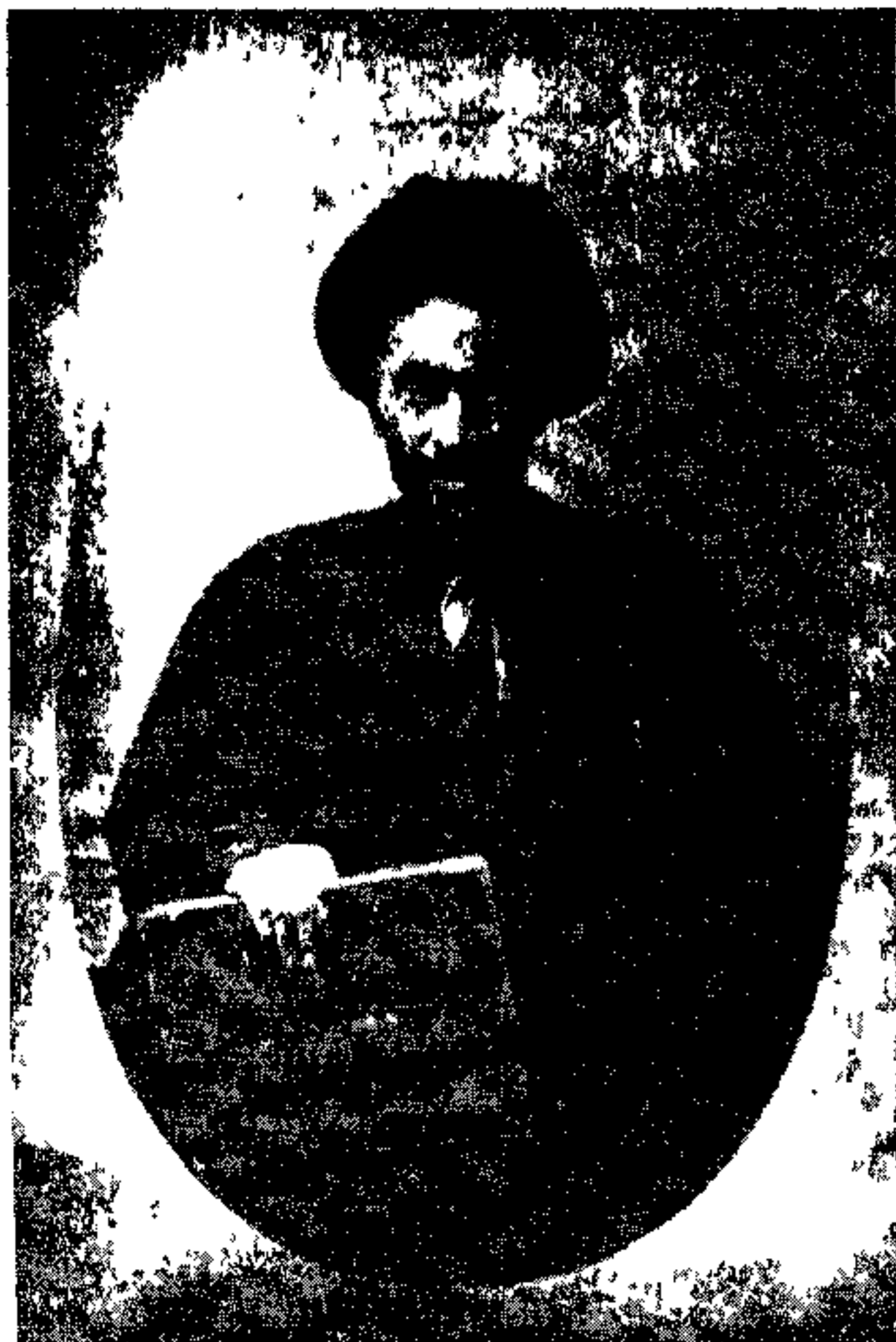
مرحوم سید جمال الدین واعظ اصفهانی