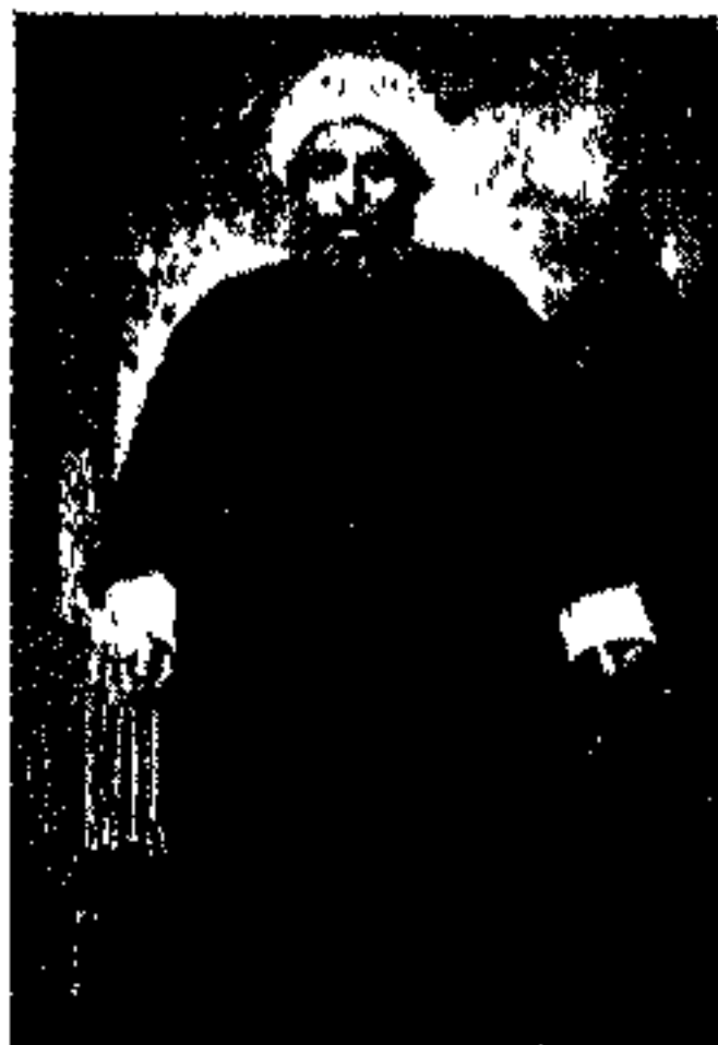
میرزا نصرالله بهشتی ملك المتكلمين

واهایی ممالکت به محمدعلی میرزا کلنل لیاخوف روسی، با عده‌ای قزاق و سرباز سیلاخوری مجلس شورایی را محاصره و بمباران کرد. هنگامی که عرصه بر مجلسیان تنگ شد هر یک بطرفی فرار اختیار کردند و ضمناً