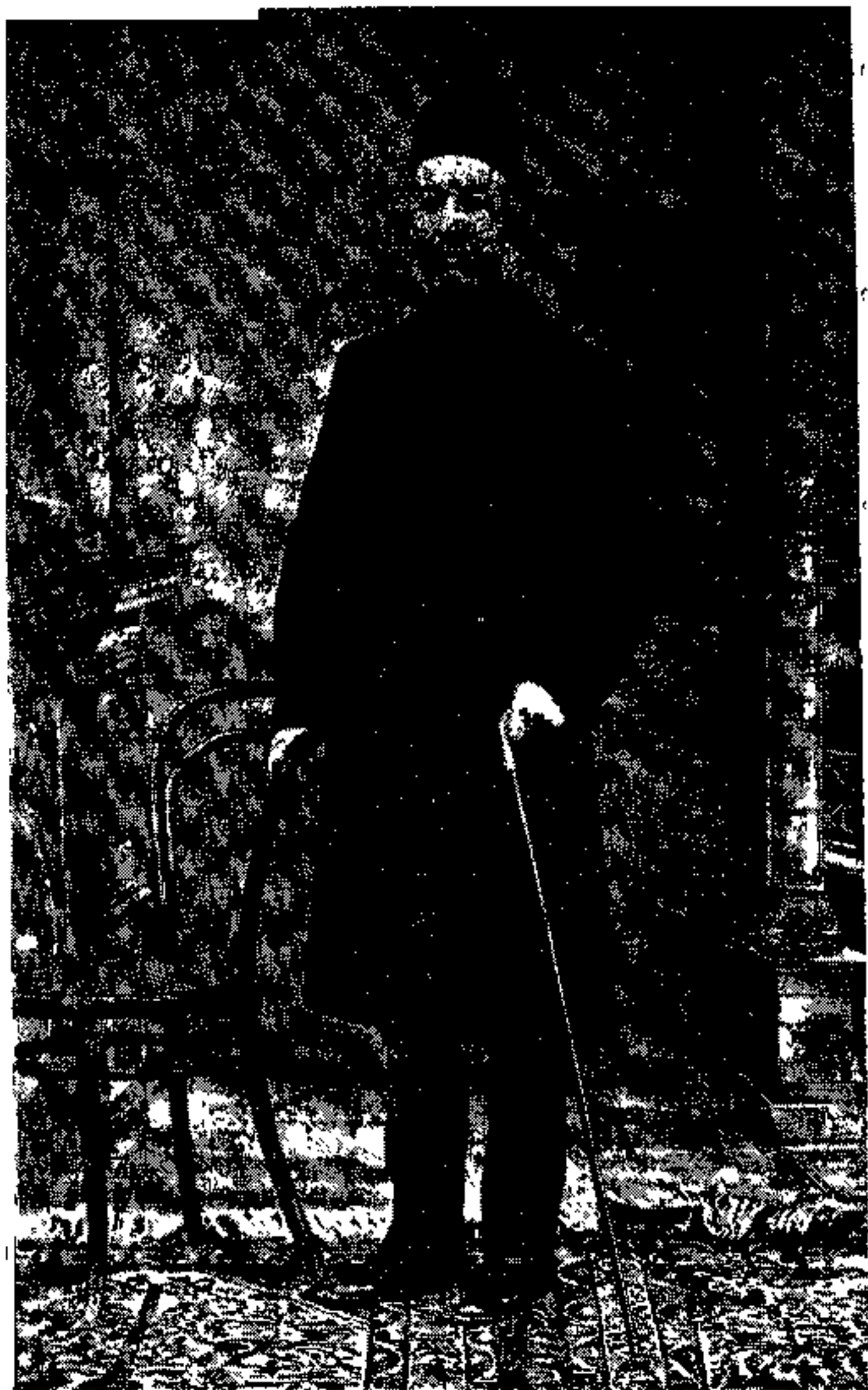
مرحوم رضاقلیخان نظام السلطنه مافی رئیس حکومت موقتی