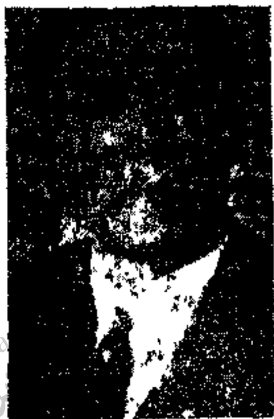
شوستر آمریکائی مستشار خزانه داری

کشور از هر جهت رو بهرج و مرج گذاشت و دولت روسیه بعنوان اینکه بواسطه طغیان ایلات و عشایر امنیت از ناحیه شمال رخت بر بسته قشون وارد خاک ایران کرد و انگلیسها هم متقابلاً در جنوب به تحکیم بنیان نفوذ خود میپرداختند، دموکراتها علناً از ناصر الملک شروع بانتقاد کردند و اوضاع بشدت رو بوخامت نهاد . در همین هنگام