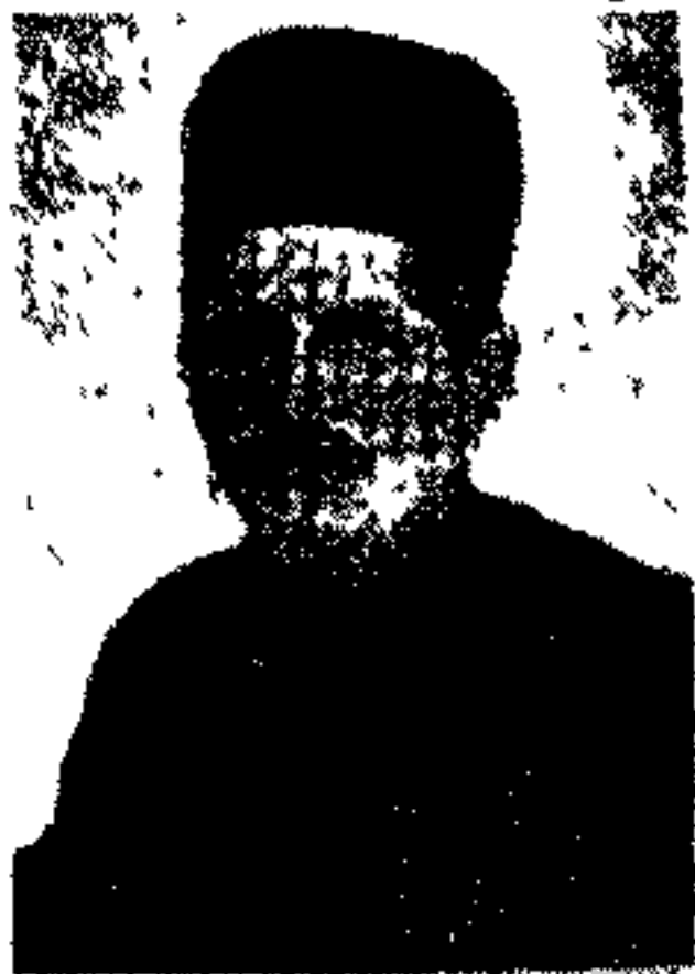
مرحوم غلامحسین خان سردار محتشم بختیاری

اردو از راه قزوین بطهران رفت و مشیر دیوان محکوم بتأدیه ده هزار تومان وجه گردید که نقداً پرداخت و مرخص شد. چون در تهران دیگر احتیاجی بسوار و تفنگچی نبود و از طرفی جیره و علیق سوار