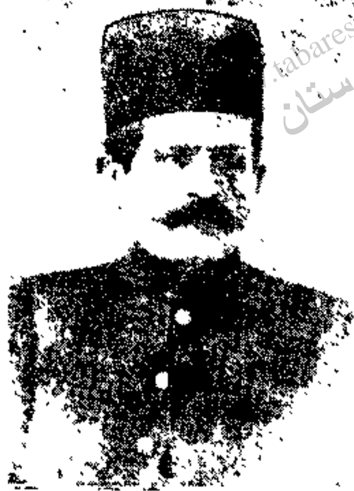
مرحوم نصیرخان سردار جنگ

اول شب موقتاً طرفین دست از جنگ کشیدند ولی پاسی که از شب گذشت عده‌ای از بختیارها بطرف کوه نیل حمله و یکی از باغات دامنه کوه را اشغال کردند .