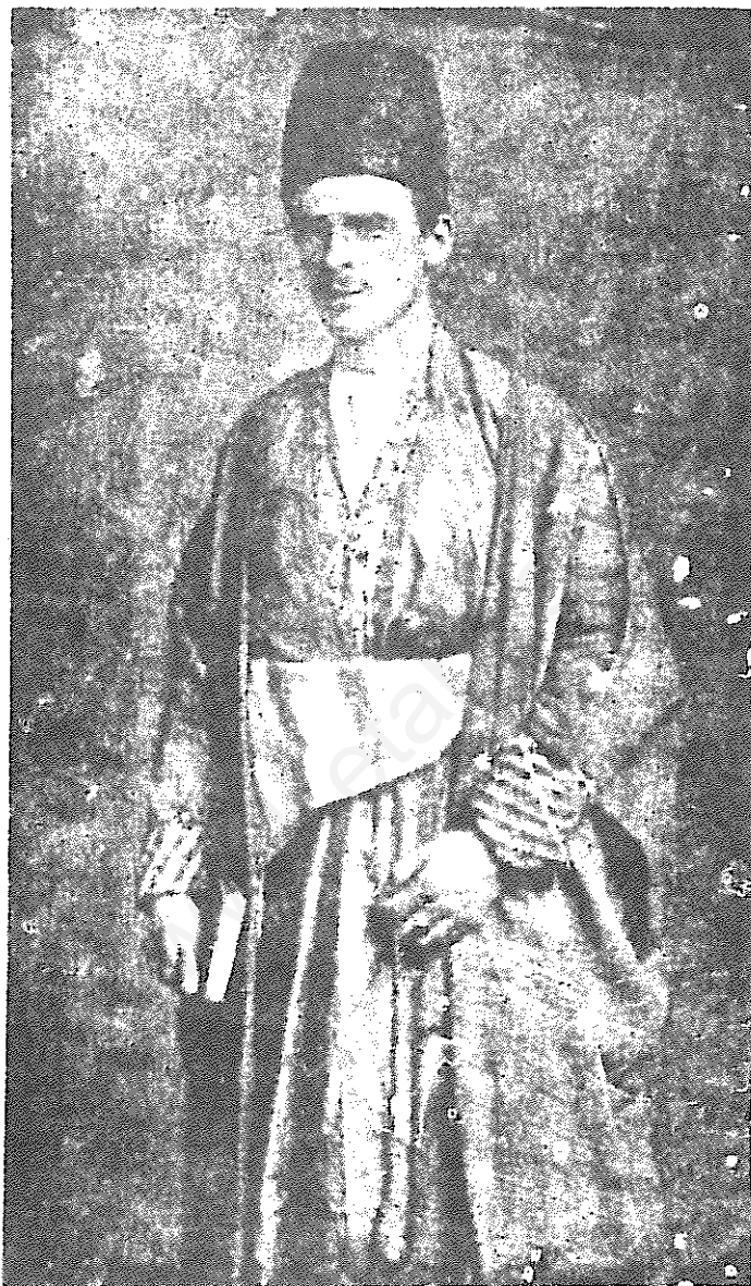
پرفسور ادوارد براون

وقایع جانگداز تبریز و اقدامات در خارج . تجارتی انگلیس جلوگیری شود ایران هم در این نفع شرکت داشته است .