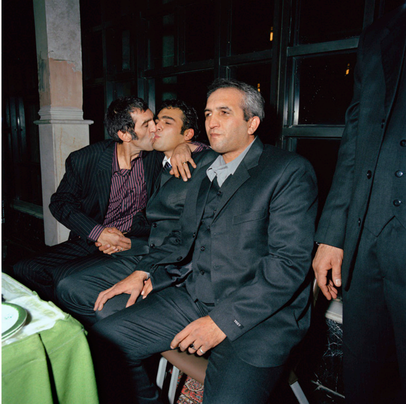
خسرو حسنزاده (سمت چپ) ۴۶ ساله. او امروز یکی از مشهورترین نقاشان ایرانی در غرب است. پیشتر او یک سرباز بسیجی در جنگ و سپس یک موز فروش بوده.

سعی می‌کنم اولین دیدارم را با خسرو حسنزاده به یاد بیاورم. فکر می‌کنم بهار سال ۱۹۹۹ بود که به کارگاهش نزدیک خیابان منوچهری رفته