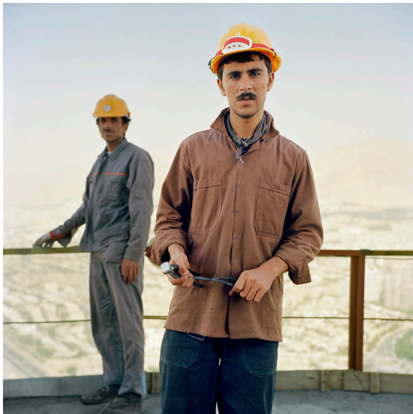
دو کارگر آذربایجانی در حال انجام آخرین ریزه کاری های برج میلاد.