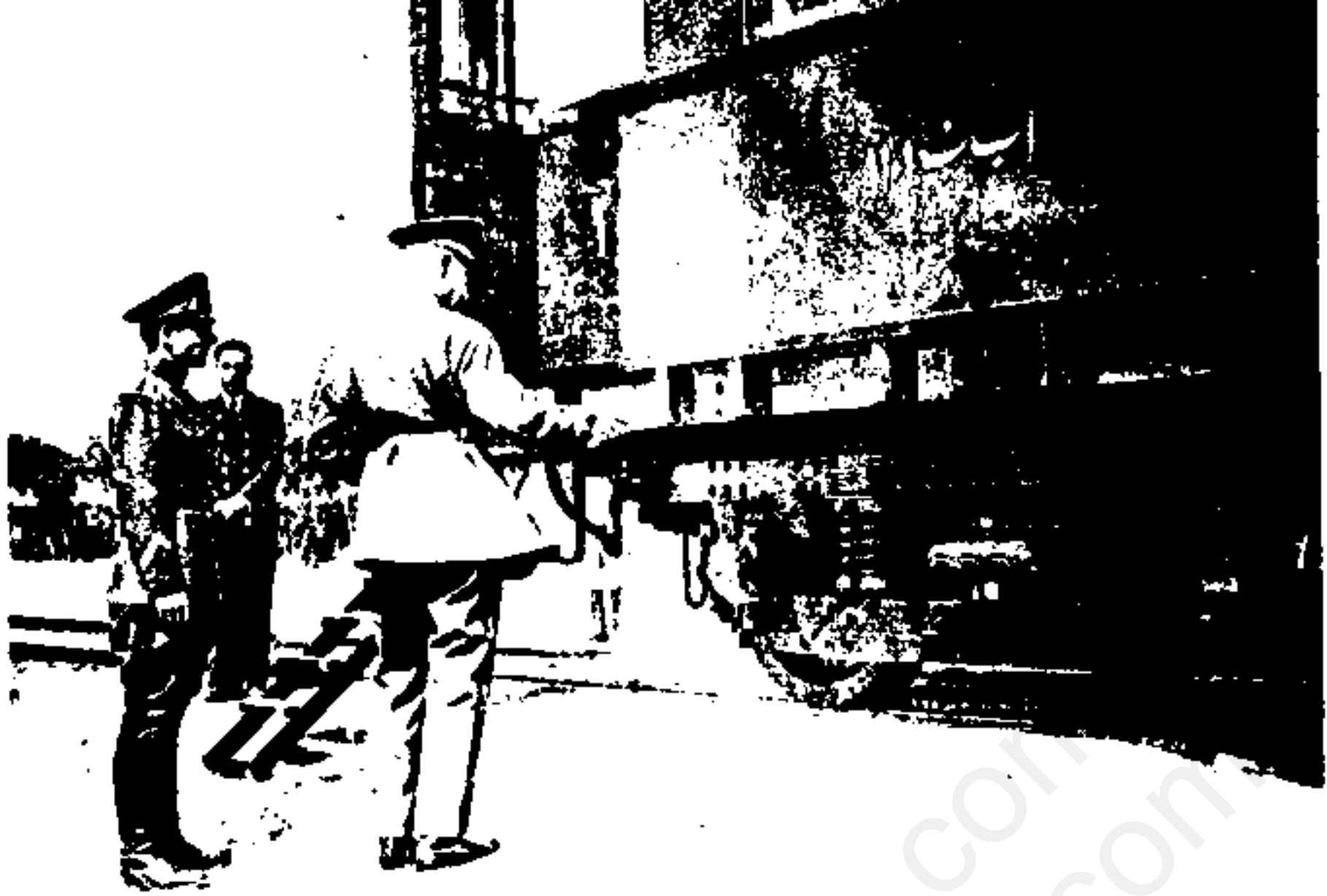
ولیعهد رضاشاه در سایه او.