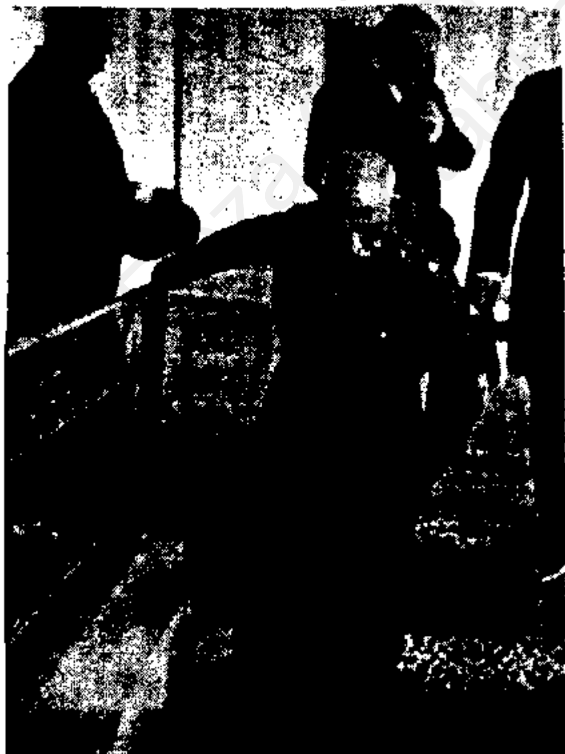
رضاشاه پیر و شکسته، پایان کار نزدیک است.