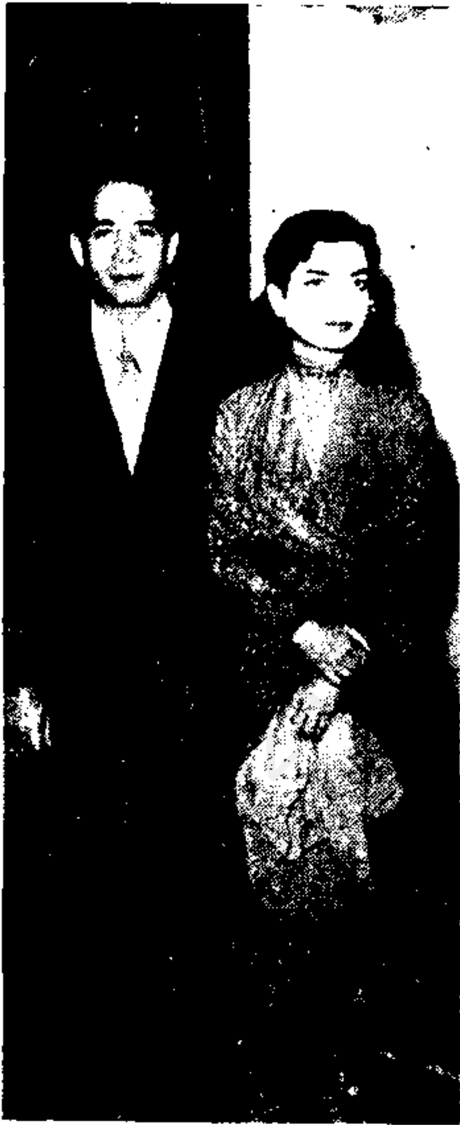
شفیق، انتخاب اشرف