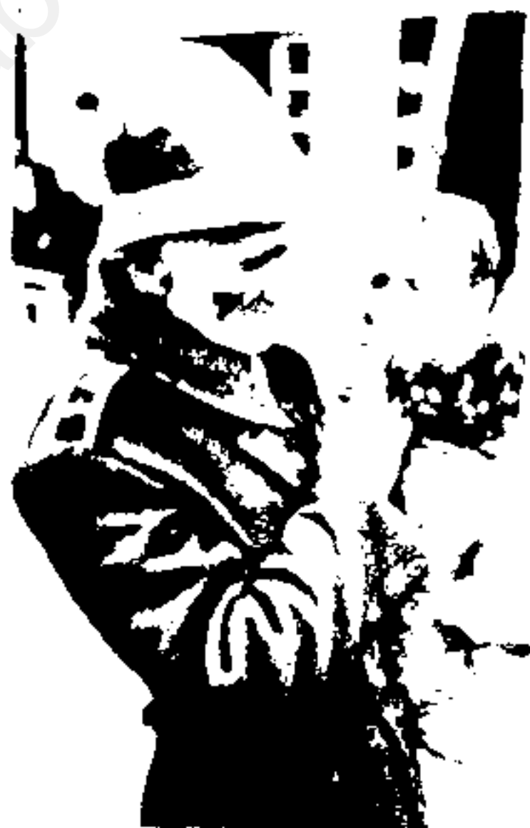
با ستوط رضا شاه، پاسبانهای نظمیه مهربان شدند!