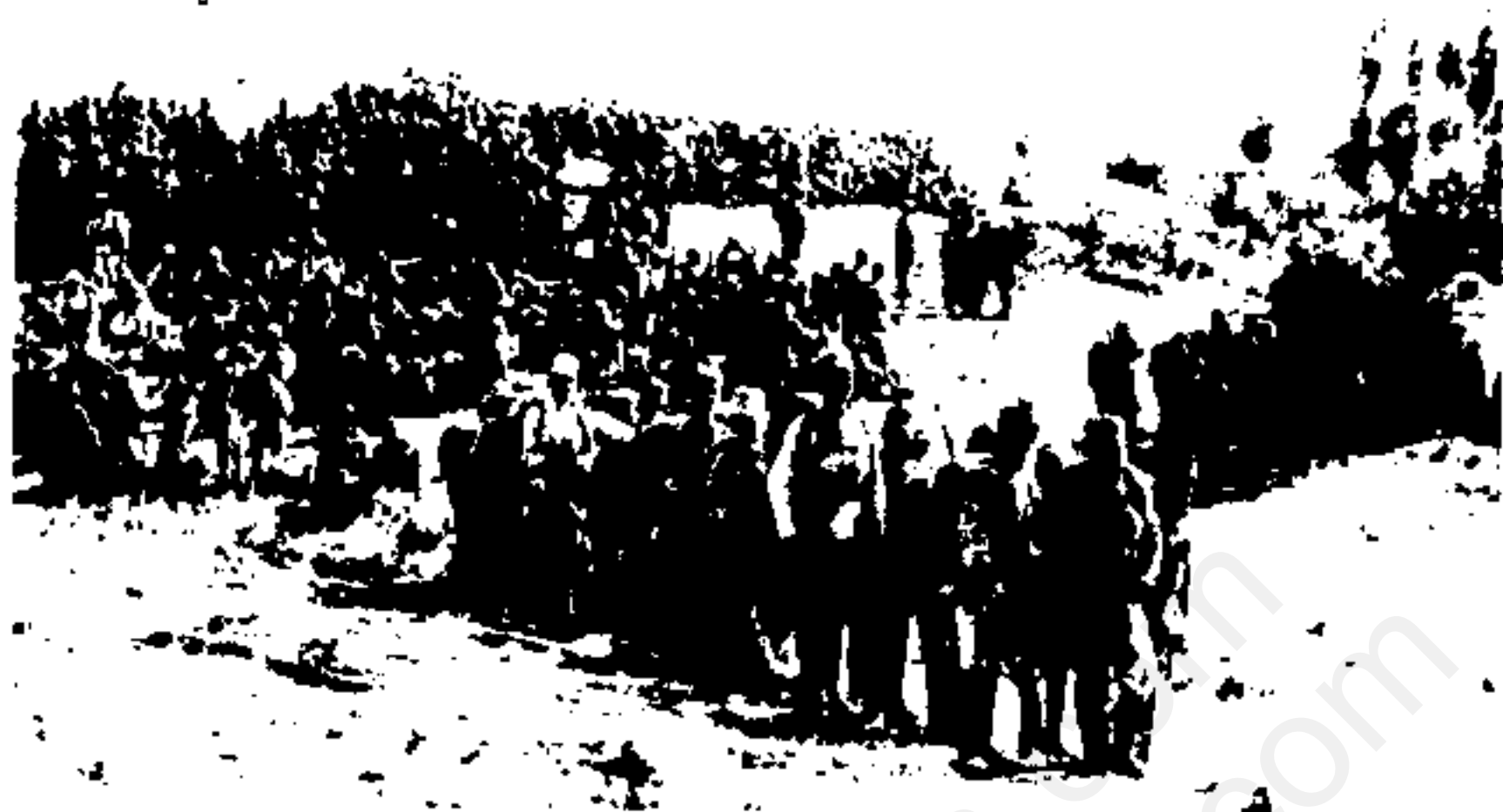
سربازان ایرانی، رها شده در بیابانهای کرمانشاه. ارتش رضاخان به پفی خاموش شد.