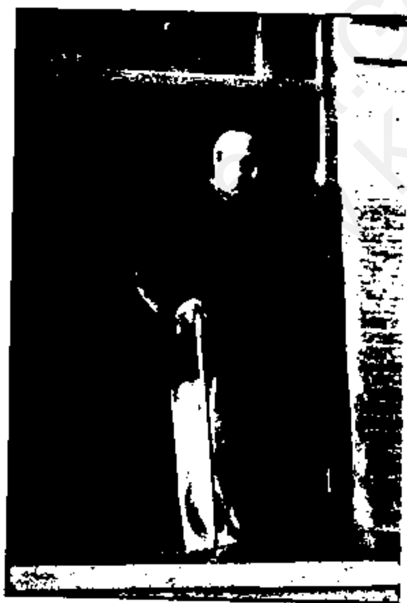
دکتر مصدق از تبعید احمدآباد به در آمد.