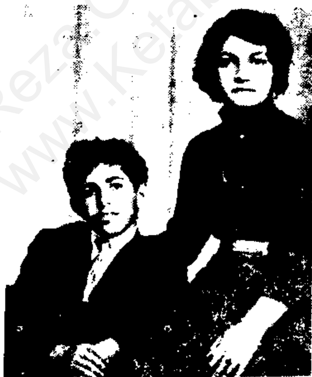
اشرف پهلوی در کنار علیرضا برادرش: تو قوی هستی