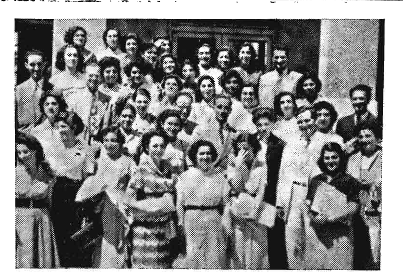
بداظهر روز پنجشنبه وزیر فرهنگ کواهینامه کلاس اختصاصی خیاطی و کلدوزی و کارهای دستی دختران راهی مراسمی اهد نمود.

نخست وزیر بار دیگر سیاست خارجی دولت خود را که بر پایه آمال و مقاصد ملت ایران قرارداد صریحاً بیان نمود در محافل سیاسی اظهارات نخست وزیر با اهمیت بسیمار تلقی شده است بر مبر کنفرانسی میبامی گره اختلافاتی بین دول بزرگ ایجاد گردیده است مناسبات هندوستان و آتازونی مورد بحث ناظرین سیاسی قرارداد