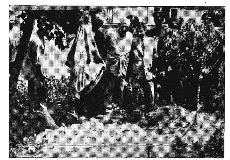
امروز با حضور فرماندار تهران و مأمورین انظامی اوراق رفراندم در باغچه فرمانداری ممدوم شد.

بیش از دو میلیون نفر از مردم ایران بپندای نخست وزیر جواب مثبت دادند و برای نخستین بار، یک امر مهم و حیاتی، یعنی