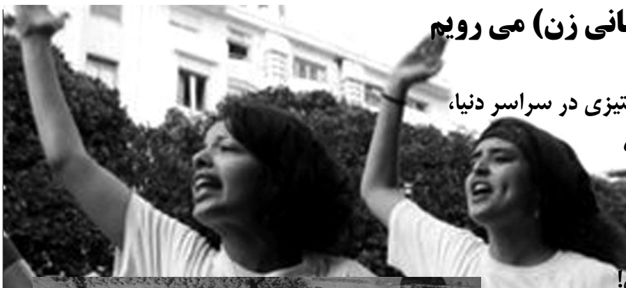
تظاهرات زنان تونس