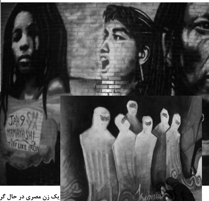
یک زن مصری در حال گرافیتی