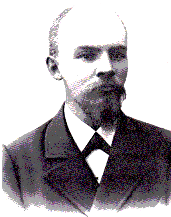
تصویر و. ای. لنین. سال ۱۹۰۰