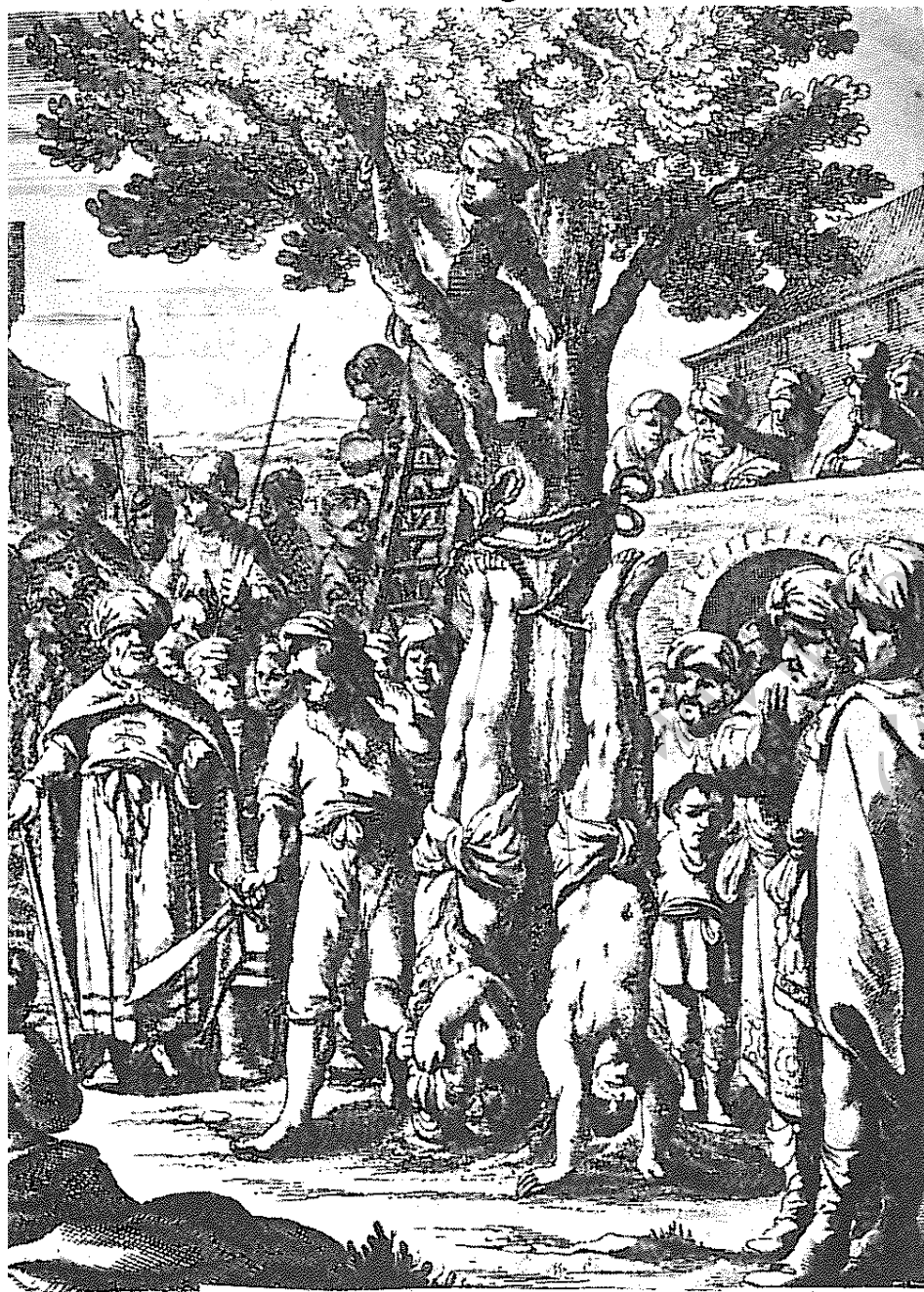
یکی از انواع مجازاتها

شد. به بود عیسویان در سال روز میلاد مسیح خوک می‌خورند، از این روی برای آنان چند خوک فرستاد. به گفته دو گوه‌آ، این کار مایه شکایت روحانیان و علمای اصفهان شد، زیرا که شاه در ماه مقدس رمضان بر خلاف قوانین اسلام رفتار کرده بود ۱۵ .