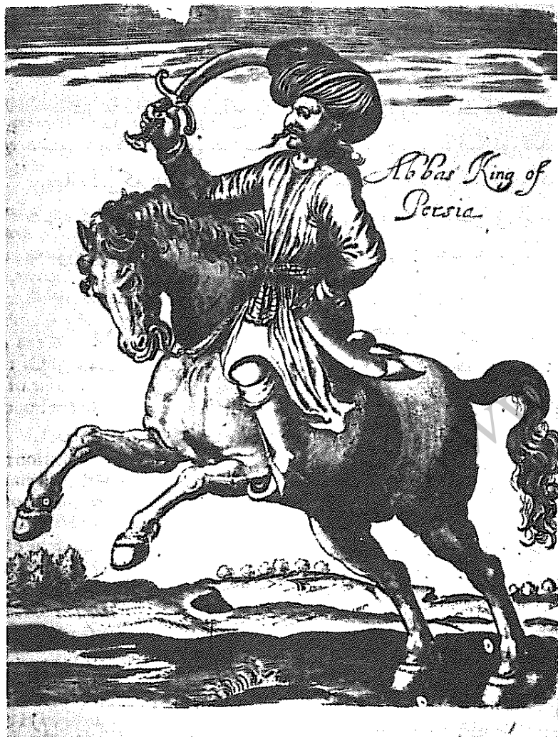
تصویر شاه عباس - سفرنامه هربرت Herbert - لندن ۱۶۳۴

می کردند، کرد و پرسید که: «اگر من عیسوی شوم، شما هم از من پیروی خواهید کرد؟» همه در پاسخ گفتند که جز موافق میل و اراده و فرمان شاه کاری نخواهند کرد.»