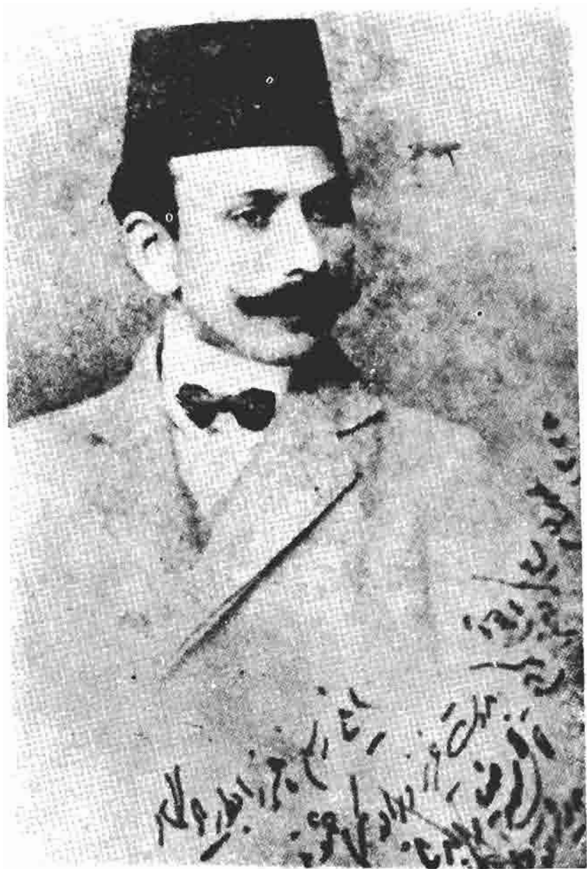
میرزا علی اکبرخان دهخدا