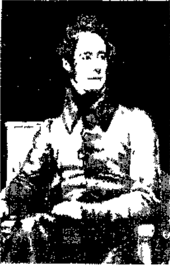
آغا میرزا اسدالله خان (۱۷۶۹-۱۸۵۹)