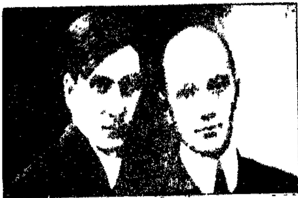
۶. ن. ناری