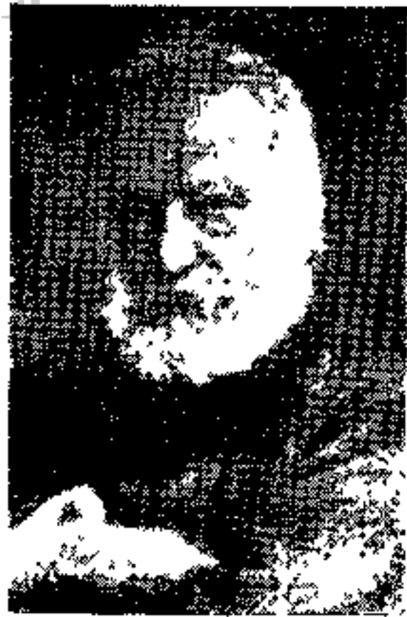
میرزا اسدالله خان (۱۷۸۵-۱۸۵۹)