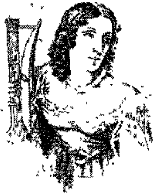
میرزا اسدالله خان (۱۷۸۵-۱۸۵۹)