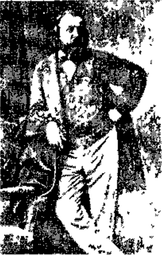
میرزا اسدالله خان (۱۷۶۹-۱۸۵۹)