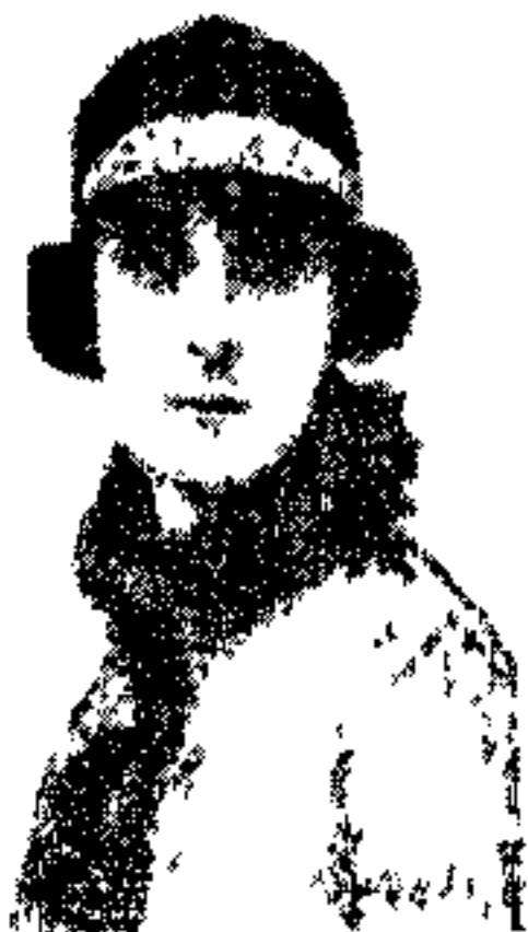
۴. س. دولر آبی (۱۷۶۲۷)