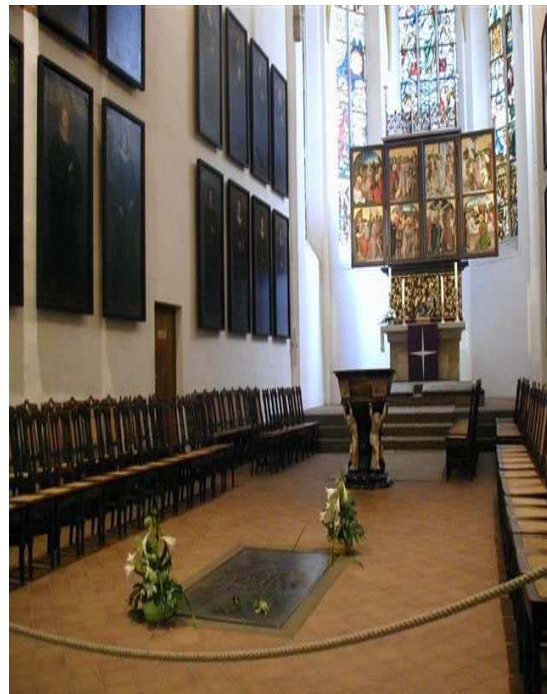
آرامگاه یوهان باخ در کلیسای سنت توماس، آلمان