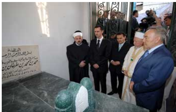
نور سلطان نزار بایف با بشارالاسد در تاریخ ۱۶ آبان ماه ۱۳۸۶ (۷ نوامبر ۲۰۰۷) در بازدید از قبر ابو نصر فارابی