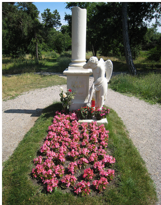
آرامگاه موتسارت، وین، اتریش