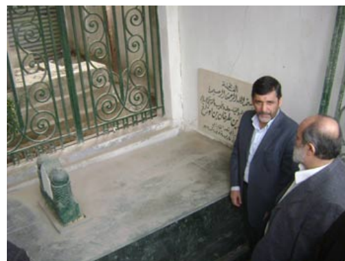
دیدار (غیر) رسمی وزیر فرهنگ و ارشاد جمهوری اسلامی ایران، محمدحسین صفارهرندی و همراهان از قبر ابو نصر فارابی ۱ دی ماه ۱۳۸۷ (۲۲ دسامبر ۲۰۰۸) (به سنگ مرمر خاک گرفته شده ی قبر ابو نصر فارابی توجه کرده و سپس آن را با عکس بالا مقایسه کنید.)