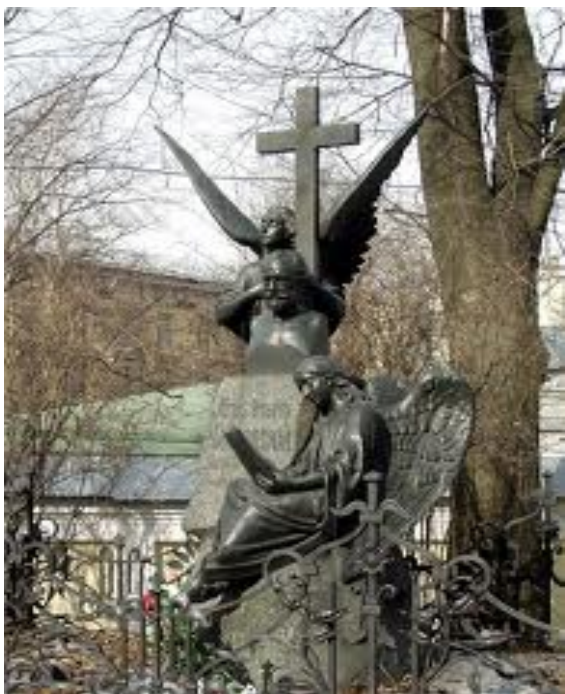
آرامگاه پیتر چایکوفسکی، سنت پیترزبورگ، روسیه