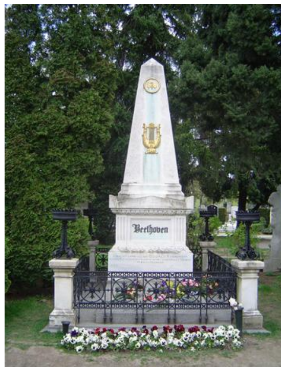
آرامگاه بتهوون، وین، اتریش