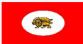
« آفا محمد خان قاجار »

آنگونه که فتح الله ... قزوینی در کتاب المعجم می نویسد: درفش را نزد عمر بردند و عمر دستور داد تا گوهرها را بردارند و پوست را بسوزانند.