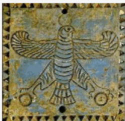
« درفش هخامنشیان »