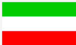
« دولت مهندس مهدی بازرگان »