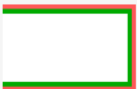
« احمد شاه قاجار »

میتراپیسم و مهر پرستی ایرانیان پرچم و سپس بروی سکه ها بوده