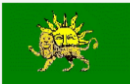
« نادر شاه افشار »

ایران از سالها و سده های کهن دارای پرچم و درفش بوده است. نخستین پرچمی که در تاریخ افسانه ای ما از آن نام برده شده درفش کاویانی است، که پیش بند چرمی آهنگری بنام کاوه بوده، این آهنگر در برابر ستم و بی داد آژدها که بپاخواست و به یاری فریدون او را فرو نشاند و فریدون را به پادشاهی رساند، فریدون نیز به پاس این یآوری و دلاوری آن پاره پوست را با دیبای زرد و سرخ و بنفش و گوهرهای فراوان بیاراست و درفش کاویانی نام نهاد، پس نخستین رنگهای پرچم ایران « زرد، سرخ، بنفش » بوده است. در اینجا باید یاد آور این نکته شد که درفش کاویانی يك درفش افسانه ای نبوده و وجود داشته، زیرا آنگونه که از برگه های تاریخی برمی آید، هخامنشیان و ساسانیان نیز درفش ملی و نظامی خود را درفش کاویانی می نامیدند که بسیار بزرگ و از پوست پلنگ بوده و گوهرهای فراوانی را به آن دوخته بودند.