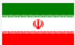
« جمهوری اسلامی ایران »

پژوهندگان نگاره های گوناگونی درباره ی انگیزه ی نقش خورشید بروی پرچم دارند: برخی این باور را دارند که تاثیر کیش کهن بزرگترین انگیزه نگارش خورشید بروی است.