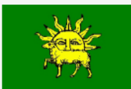
« شاه تهماسب صفوی »