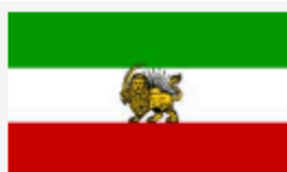
« سلسله ی پهلوی »

در این میان به نمونه هایی برمی خوریم که نشان می دهد در میان اتابکان پارس و خوارزمشاهیان نه تنها پیکره ی شیر از روی پرچم برداشته نشد بلکه نقش خورشید نیز بر پشت و بالای سر شیر آمد.