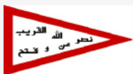
« ناصرالدین شاه قاجار »