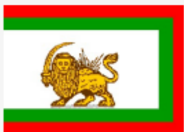
« محمد علی شاه قاجار »