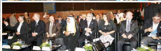
از راست: محمد ابو هویب، نماینده مجلس اردن، حیا شیطانی، نماینده وفای ملی عراق، نریمان الرومان، نماینده پارلمان اردن، محمود العبادی، نایب‌رئیس مجلس اردن، شیخ مزین حبیب خیزران، شیخ کل عشره العمزه عراق، مفتاح الرحیمی، رئیس فراکسیون اکثریت پارلمان اردن، منیر صوبور و یحیی العموری، نمایندگان مجلس اردن