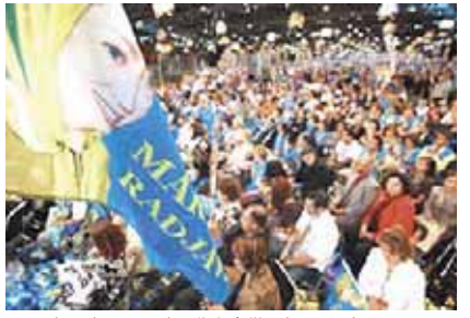
مریم رجوی در سخنرانی خود در جلسه ۲۸ژوئن ۲۰۰۸ در ویلنیت در محومه پاریس علیه سستنی اتحادیه اروپا در رابطه با رژیم ایران اعتراض می‌کند. مجاهدین خلق از اواسط دهه ۱۹۸۰ با دولت اسلامی تهران در جنگ حاکم بوده‌اند.