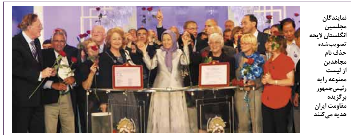
نمایندگان مجلسین انگلستان لایحه تصویب شده حذف نام مجاهدین از لیست ممنوعه را به رئیس‌جمهور برگزیده مقاومت ایران هدیه می‌کنند

• لرد کوربت، رئیس لردهای حزب کارگر انگلستان: پیروزی حذف نام مجاهدین از لیست تروریستی، تنها پیروزی ما نیست، پیروزمندان واقعی ۴۰۰۰ نفری هستند که در شهر اشرف در تبعید در بیابانهای عراق به سر می‌برند. پیروزی آنها پیروزی میلیونها ایرانی است که خواستار تغییر برای تحقق یک کشور دموکراتیک و مبتنی بر جدایی دین از دولت هستند. این پیروزی و این گردهمایی قدم بزرگی برای رسیدن به یک ایران آزاد است. این گردهمایی نشان می‌دهد که ملامای حاکم بر ایران ضربه‌پذیر هستند و میلیونها ایرانی تنها نیستند