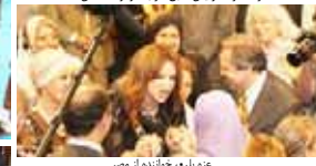
عزه بلخ، خواننده از مصر