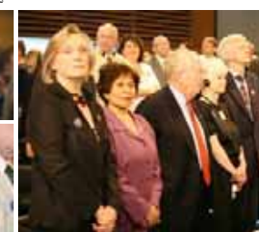
از راست: جودیت گانگور، وزیر سابق کشور در امور امریکای لاتین و آسیای پامسیک، فورا گانگور، مشاور، پرونده استیست، ریاستن ژاکسی و کارولین بنت، نمایندگان پارلمان کانادا