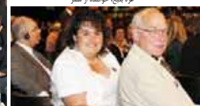
لردو و میلی فایه، نمایندگان پارلمان کانادا