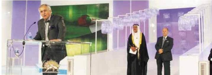
سید احمد غزالی

مقام کمیته بین‌المللی حقوق بشر که فکر می‌کنند می‌توانند با اقدامات خود به حقوق بشر در ایران کمک کنند، باید بدانند که این اقدامات هیچ‌گونه تأثیری در حقوق بشر ایران ندارد. این اقدامات فقط برای جلب توجه افکار عمومی است و هیچ‌گونه تأثیری در حقوق بشر ایران ندارد.