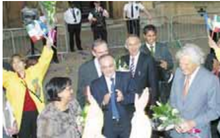
شرکت لرد اسلین در جشن خیر نام مجاهدین از لیست سازمانهای ترویجی انگلستان