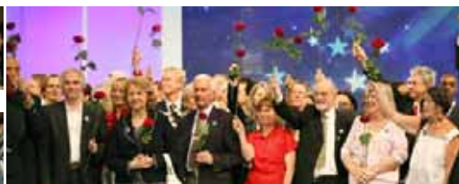
هیاتهای اسکانیدیناوی، آلمان و فرانسه