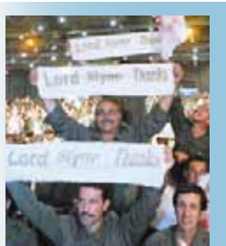
گل اهدایی رزندگان شهر اشرف به لرد اسلین

از سخنرانی مریم رجوی: جلسات مجلس عوام و مجلس اعیان به هنگام تصویب این لایحه، صحنه بی سابقه‌یی در تحولات مربوط به ایران است. مردم ایران به چشم دیدند که در پارلمان یکی از پنج قدرت اصلی دنیا دفاع بسیار سرسخانه‌یی از مقاومت مردم ایران علیه فاشیسم مذهبی صورت می‌گیرد. شمار کثیری از نمایندگان با برانگیختگی و احساس مسئولیتی ستودنی -آمیزه‌یی از شرافت، شجاعت و دادخواهی - از ضرورت پایان دادن به فاجعه سیاست مماشات و از دردهای مردم تحت ستم ایران سخن گفتند. راستی که آنها سیاست را با انسانیت و آزادی در آمیختند. لرد اسلین با ایقان و شجاعت از خجانتی حکم دادگاه انگلستان و حکم دادگاه لوکزامبورگ درباره بی‌اعتباری اتهام تروریسم علیه مجاهدین سخن گفت.