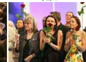
از راست: جاسلین اسکات، سونتا هوبوی، نماینده مجلس و وزیر ادو و توری، مریدیس برکمن، رئیس اسبق پارلمان نیویورک و ژان استرالیا