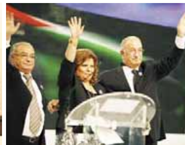
هیأت نمایندگان پارلمان اردن

از راست: فردریک روس، به نمایندگی از قلیب موزر، نماینده مجلس ملی فرانسه، فرانسوا کولکومبه، نماینده قلمی پیشین فرانسه، ایو بونه، رئیس داس، ت، آن یوین، وزیر مشاور سابق، ژان پیر بکه، شهردار اور سور، اولژا مورس، بوسکاور، شهردار لورنی