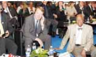
ننا ونشاسو - یونان