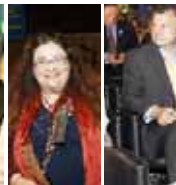
آلدو فوربیچه - ایتالیا