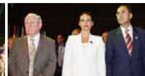
از راست: الخویدمال کوادراس، نایب‌رئیس پارلمان اروپا، خاتم کوادراس، لرد کلارک، رئیس سابق حزب کارگر انگلستان