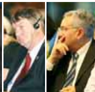
ژان پیر مالمندیر - بلژیک