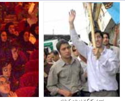
اعتصاب کارگران شهرداری کرمانشاه

تظاهرات دانشجویان دانشگاه لرستان در اعتراض به جان‌باختن یک دختر دانشجوی