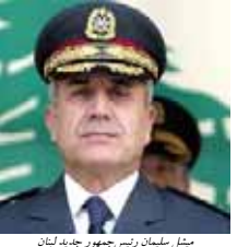
میشل سلیمان رئیس‌جمهور جدید لبنان

پس از کودتای خونین و تفرقه‌رزمی آخوندی در لبنان، روز اول خرداد، جناح‌های مختلف این کشور پس از شش روز مذاکره در دوحه، توافق پشنه‌اندی فطری امضا کردند تا به بحران سیاسی ۱۸ماهه این کشور پایان دهند. این توافق شامل تعیین رئیس‌جمهور جدید است. تشکیل یک دولت وحدت ملی جدید بود. براساس این توافق در کابینه لبنان، ۱۶کسی به جناح اکثریت، ۱۱کسی به مخالفان دولت و ۳کسی به رئیس‌جمهور دادند. همچنین ۳کسی به این کمیته‌ها و ۱۶کسی به این کمیته‌ها شدند. توافق مذکور همچنین به جناح اکثریت اجازه داد که نخست‌وزیر را انتخاب کند. حد فاصل نظر ماجراجویی فواد السنیوره نخست‌وزیر لبنان، با استقبال از افزایش دوحه، آن را گام مهمی برای گسترش حاکمیت دولت در لبنان بیان دانست. سمع‌گری بر اثر اکثریت پادشاهی لبنان نیز اطمینان از توانایی این کشور در امور داخلی و خارجی آن را نشان داد.