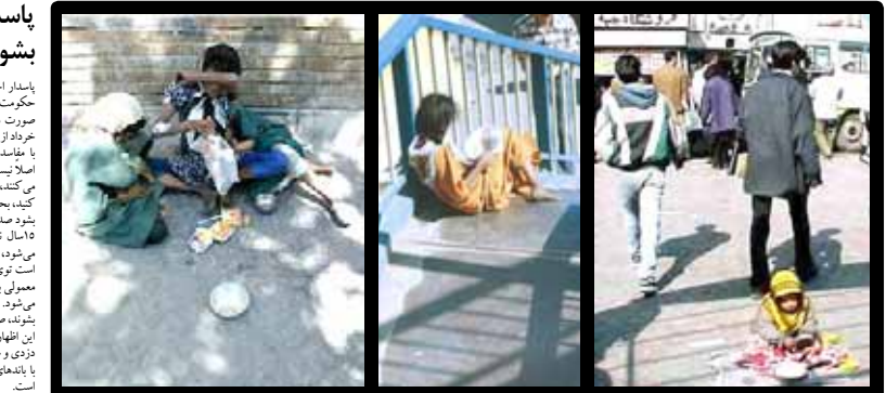
سنگوی کابینه پاسدار احمدی نژاد: یک قشر معدود به اندازه انگلستان یک دست از ۹۴ هزار میلیارد تومان استفاده می کنند و یک قشر بزرگ از شش هزار میلیارد تومان