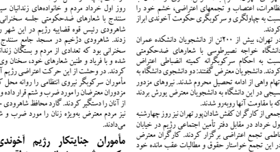
اعتصاب کارگران شهرداری کرمانشاه

تظاهرات هموطنان آذری در سالگرد قیام مردم آذربایجان