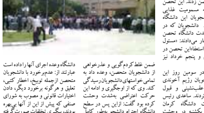
اعتصاب دانشجویان دانشگاه سهند اهواز

تظاهرات دانشجویان دانشگاه لرستان در اعتراض به جان‌باختن یک دختر دانشجوی