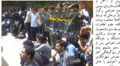
اعتصاب دانشجویان دانشگاه سهند اهواز

تظاهرات دانشجویان دانشگاه لرستان در اعتراض به جان‌باختن یک دختر دانشجوی