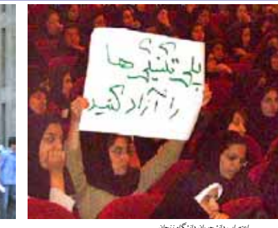
اعتصاب دانشجویان دانشگاه زنجان