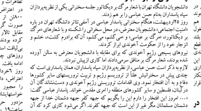
اعتصاب کارگران شهرداری کرمانشاه

تظاهرات هموطنان آذری در سالگرد قیام مردم آذربایجان