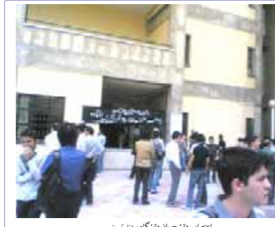
اعتصاب دانشجویان دانشگاه سهند اهواز

وزیم آخوندی برای دردم شکستن اعتصاب، دیکتاتور سرکوبگر، حاکم بر ایران، چهر سرکوب و تبعامراه راه دیگری برای مقابله با خواستهای عادلانه مردم ایران در چپته نارادر تغییر رژیم آخوندی و استقرار دموکراسی و حاکمیت مردم، اولین و بهترین خواست عموم مردم ایران است.