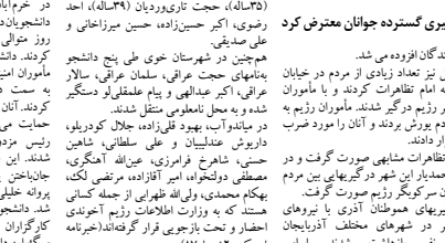
اعتصاب کارگران شهرداری کرمانشاه

تظاهرات هموطنان آذری در سالگرد قیام مردم آذربایجان