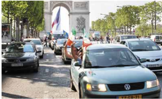
پاریس - فرانسه