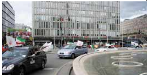
استکهلم - سوئد