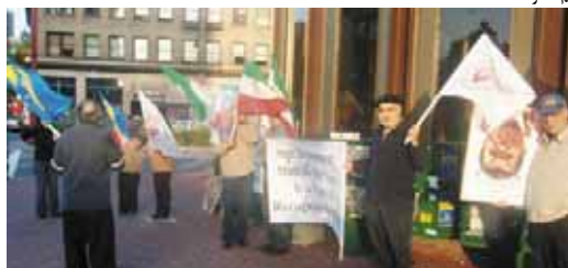
برکلی - آمریکا