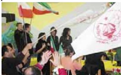
زوریخ - سوئیس