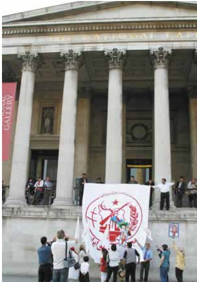
لندن - انگلستان