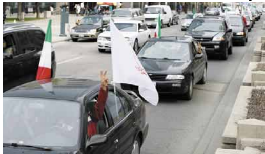
تورنتو - کانادا