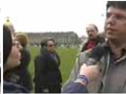
تجمع مزدوران در مقابل پارلمان فرانسه ۲۹ مارس ۲۰۰۵