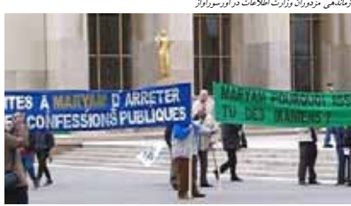
تظاهرات مزدوران در میدان ترکاودو پاریس - ۲۹ مارس ۲۰۰۵