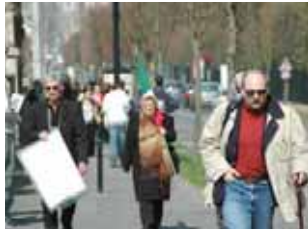
تظاهرات مزدوران وزارت اطلاعات در اورسوواژ