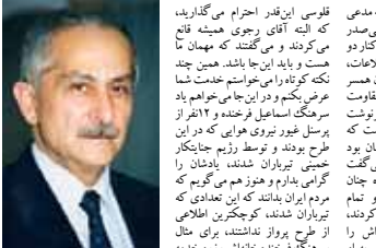
هیچ وقت دوستی با بنی‌صدر نداشته، و نخواهم داشت، تا زمانی که ایشان یورش به سمت رژیم جنایتکار آخوندی است. بهر آن ملت کوهنایی که پناه برده در دامان جوسرمده آقای رجوی.

تعمیرالکبیر بود که کسی که مدعی بود و مرتب می‌گفت که بنی‌صدر سرحدرد است در دادگاه بود. هر چند مست و بیاد این جا باشد، همین چند نکته کوهنایی را می‌خواستم تمام عرض کنم و در این جا می‌خواهم یاد سرسنگ اسماعیل فرخنده و دکتران را بفرماید که بنی‌صدر تیراندازی جنایتکار خبیث تیرباران شدند، یادشان را مدافعت می‌کنم و می‌گویم که مردم ایران بلدند که این تعدادی که سرحدرد فرزند خدای زرتو خنده بود، یعنی اگر مشکلی پیش بیاید، ما فرار بودیم چانه از غلغله را در اختیار گذاشته بود، بدون این که بدانند. برای چیست. فرض از گرفتار شدن قساوت آن بود که یادآوری این نکته را بکنیم، که