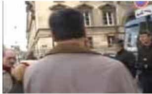
تجمع مزدوران در مقابل پارلمان فرانسه ۲۹ مارس ۲۰۰۵