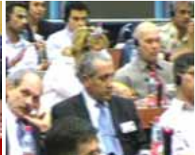
همراه مزدوران در پارلمان اروپا ۲۹ ژوئن ۲۰۰۶