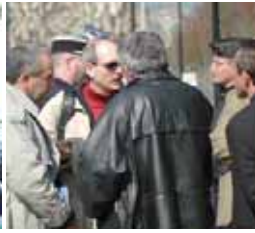
سازماندهی مزدوران در مری سوواواژ ۲۹ مارس ۲۰۰۵