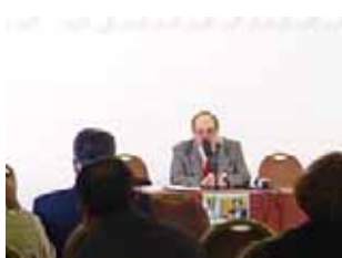
جلسه مزدوران - لندن نوامبر ۲۰۰۵