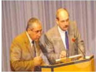
جلسه مطبوعاتی مزدوران در سوئد - استکهلم - دسامبر ۲۰۰۷