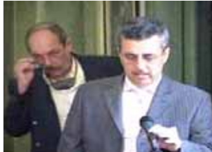
جلسه مزدور رانسگو - پاریس ۲۸ ژوئن ۲۰۰۵