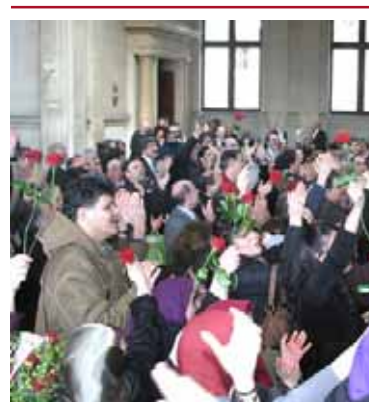
مهرمان پس از اعلام رأی دادگاه به دشمنان برخاست