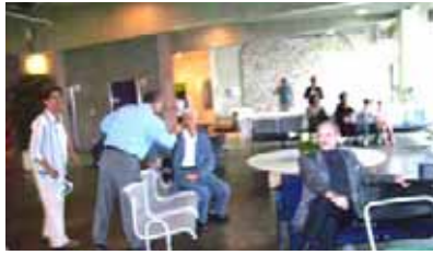
آلن شوالرئیس در صحنه درگیری مزدوران جهاادگار با پانته گان ایرانی در قیاب پاریس