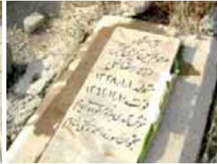
حسین کریمی بخش تاریخ شهادت: ۱۰ اسفند ۶۲