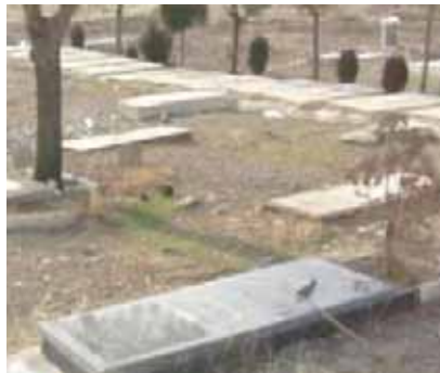
میهمانی ناشناس گاه به گورها سر می زنند و با گلی خاطره شهیدان را زنده نگه می دارند