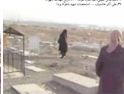
قطعه شهیدان گورستان بهشت سکینه قطعه برت و گمنامی است که هزار گاهی میمانی را پذیرا می‌شود. بسیاری از گورها توسط خانواده‌ها شناسایی نشده‌اند اما مردم با حقیقت‌نسیب به فرزندان مجاهد و مبارزان به آنها رسیدگی کرده‌اند