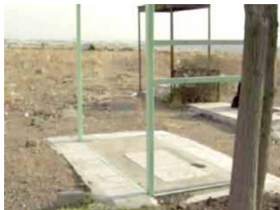
گورستان بهشت سکینه که نزدیکی زندان قزلحصار کرج قرار دارد و از دور برج زندان و دیوارهای آن را می‌شود دید