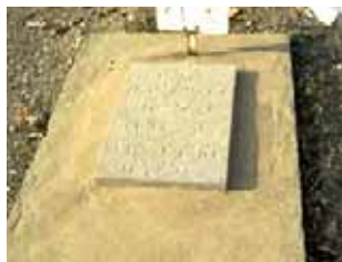
اصغر غفوری تاریخ شهادت: ۲ مهر ۶۴