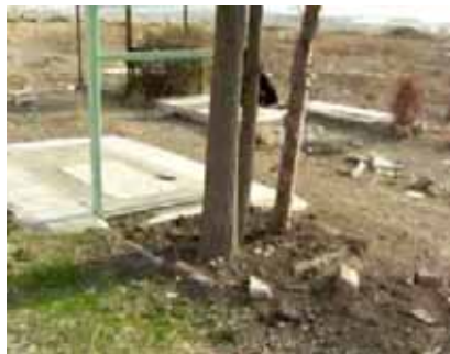
گاه ردیف گورها را به صورت مجموعه‌ای دو سه تایی می‌یابیم و گاه به صورت تکی، برسر برخی مزارها درختی دیده می‌شود. اما اغلب گورها سنگناشان شکسته است