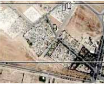
گورستان بهشت سکینه واقع در کیلومتر ۱۴ اتوبان کرج - قزوین بر روی نقشه