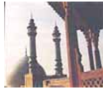
در صفحه ۱۱