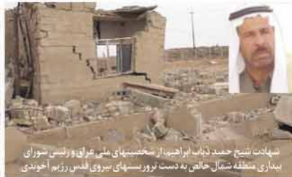
سپهات نسج حمید ذباب ابراهیم، از شخصیتهای ملی عراق و رئیس شورای مبارزی منطقه شمال خالی به دست تروریستهای نیروی قدس رژیم آخوندی

این انفجار روز جمعه ۱۹ بهمن ۸۶ توسط مزدوران نیروی تروریستی قدس سپاه پاسداران رژیم آخوندی با کارگذاشتن بیش از ۲۰۰ کیلوگرم تی.ان.تی شدیداً انفجار صورت گرفت و موجب تخریب، پیمهای بزرگ آبرسانی و تجهیزات و تأسیسات ایستگاه و منطهای کارکنان این ایستگاه گردید. مرکز آبرسانی اشرف علاوه بر شهر اشرف آب مورد نیاز کشاورزی و معیشتی بیش از ۲۰ هزار تن از اهالی منطقه را تأمین می کرد.