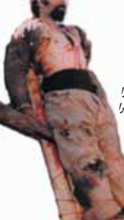
پیکر عقاب سرفراز کوههای سمیرم

خالصه شده از نشر به مجاهد ۴۲۳- فروردین ۷۸