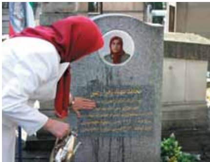
رئیس جمهور برگزیده مقاومت بهرامزاده مجاهد قهرمان زهرا رجبی در برلین فرانکفورت

سراسر دشت خاوران سنگی نیست / از عزمی زویم آخوندی در استانبول / کز خوند دل و دیده در آن رنگی نیست