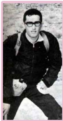
دردهای مردم غافل نبود. در آخرین روز زندگی گفت برای اینکه درخت انقلاب خشک نشود خون ما باید ریخته شود. ما خون خود باید مسیح حتی و عدالت و مایه و مبارزه را به‌طور مشخص ترسیم کنیم.

میان گلکهای است که با نوازش از نسیم پیرایشی از مهابت می‌شوند همیشه با بوسه‌های می‌مرند، با این همه اندوه، شرح کدام بغضی؟ خاوران کدام طلوع اشک؟ باختر کدام سوزی؟