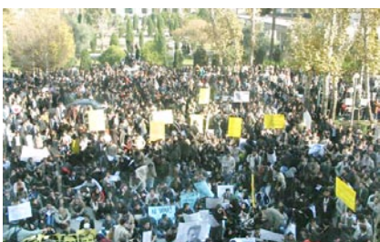
در ادامه تظاهرات دانشجویان دانشگاههای سراسر کشور به مناسبت یزدگداشت ۱۶ آذر