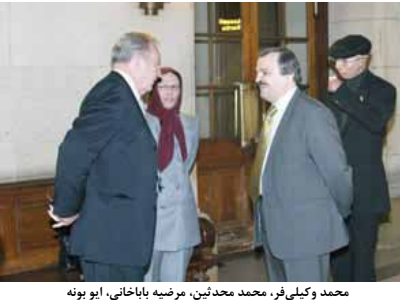
مولود آتوتیت، آلن ویوین، سناتور میشل در محوطه دادگاه

فرانس که کارت سفید به ۳۰۰ نامآور پلیس داده بود که به خیانت کنند، بی تردید ترجیح می دهد که خود را به آتش بکشد تا با چنین سرنوشتی مواجه نشود. محمد محدین: گزارش سرویسهای فرانسوی مبنی بر این که خودسوزیهای پس از ۱۷ ژوئن براساس دستور صورت گرفته، بی اساس است