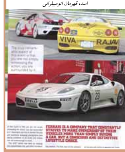
اسد، قهرمان اتومبیلرانی

چند هفته اخیر با کار روی ماشین فراری که قدرت آن را بالای ۵۰۰اسب بخار رسوندیم با شرکت در این مسابقه به مقام سوم دست یافتیم. اجازه دهید من هم در این جایگاه هم قهرمانان و ورزشکاران هوادار مقاومت ایران که همه افتخار خوششان را به رئیس‌جمهور مریم رجوی تقدیم می‌کنم، منم این جام قهرمانی مقام سوم را به مقام ایشان تقدیم کنم و این چک به مبلغ ۵۰۰۰دلار را که به عنوان جایزه این مسابقه است بعنوان همیاری به سیمای آزادی تقدیم کنم. من در هر موفقی که توانستم چه به عنوان خیرنگار و چه به عنوان همیار و گزارشگر سیمای آزادی هرچقدر توانستم همیشه سعی را پشتیبانی و کمک کرده‌ام. در این‌جا از همه هوطنان، دوستداران مقاومت و طرفداران سیمای آزادی ازتون تشکر می‌کنم که به هر ترتیبی که می‌توانند به این سعاد صفا مقاومت مردم ایران کمک کنید تا روزی که همه ما در سایه نهای خیمونان که با دشمن مردم ایران است، با دشمن خاک پاک ایران است، یعنی روزی آخوندها، پیروز بشویم و به امید آن‌روز که در ایران آزاد و آباد همه صدیک را ببینیم و جشن بزرگ بپایا کنیم. به امید پیروزی در آینده نزدیک