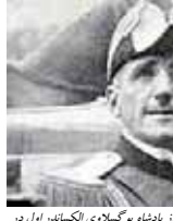
بارتو وزیر خارجه فرانسه هنگام استقبال از پادشاه یوگوسلاوی الکساندر اول در نید ماریس - آگست ۱۹۳۴