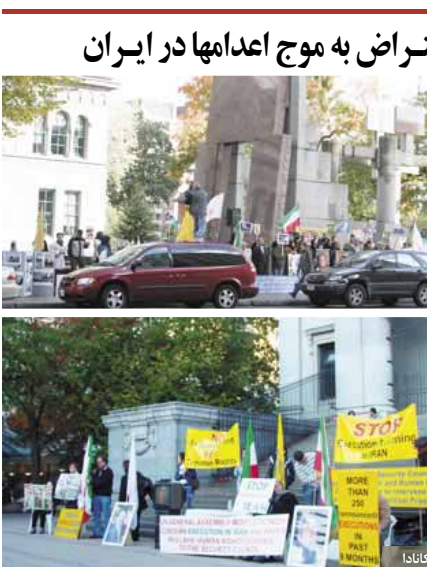
اتحادیه اروپا به عنوان یک قدرت بزرگ جهانی وظیفه دارد و می تواند ابتکار عمل و رهبری جهان را در بهر بازو در آفریند رژیم ایران به عهده نگردد