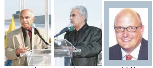
ایرانیان حامی مقاومت در تظاهرات خود در مقابل ساختمان اجلاس شورای وزرای خارجه اتحادیه اروپا در لوکزامبورگ خواستار اتخاذ سیاست قاطع اروپایی علیه رژیم آخوندی و پایان دادن به سیاست ننگین مماشات در قبال این رژیم فاشیستی شدند.

تظاهراتندگان از اعمال ترحمیهایی همه جانبه اقتصادی و سیاسی و تسلیحاتی علیه رژیم نامشروع آخوندی حمایت کردند و بر اجرای حکم تاریخی دادگاه عدالت اروپا در لوکزامبورگ مبنی بر تجسس تروریستی علیه مجاهدین خلق ایران تأکید کردند. تظاهراتندگان و سخنران برنامه اصوات شورای وزرای اتحادیه اروپا بر حفظ این برچسب ننگین را به عنوان شاخص سیاست شوم مماشات و باج دادن به تقاسیم مذهبی به شدت محکوم نمودند.