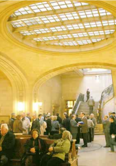
کوهن سابان، وکیل