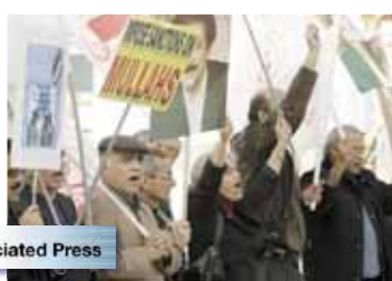
زیم رنده داد که سیاست زدن برچسب ناپسند تروریستی به همین سازمان مجاهدین ستون فقرات مقاومت مردم ایران ادامه دهد. اتحادیه اروپا باید تا دیر نشده به جبران این خطاها پردازد.