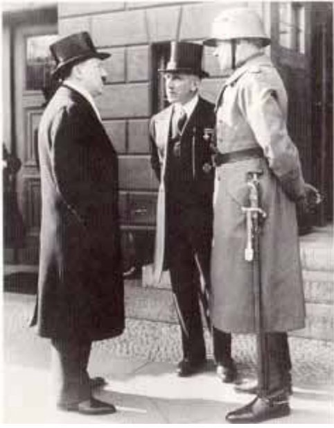
هینتر در لباس صدارتظمی آلمان، به اتفاق قون پابن معاونش و ژنرال فوالبومرگ وزیر دفاع کابینه