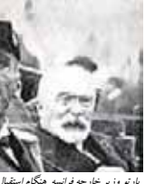
بارتو وزیر خارجه فرانسه هنگام استقبال از پادشاه یوگوسلاوی الکساندر اول در نید ماریس - آگست ۱۹۳۴