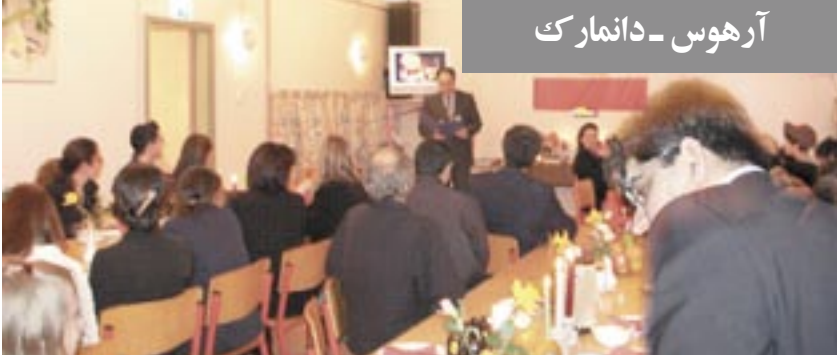
آرهوس - دانمارک