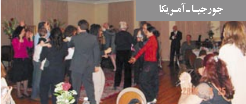
چورجیا - آمریکا

به‌مناسبت فرارسیدن نوروز ۸۵، ایرانیان آزاده و حامیان مقاومت طی اولین روزهای سال جدید، در شهرهای مختلف اروپا و آمریکا، جشنهای بزرگی برگزار نمودند. در این برنامه‌ها سخنرانی نوروزی خانم مریم رجوی رئیس‌جمهور برگزیده مقاومت پخش گردید. سپس هنرمندان به اجرای برنامه‌های هنری پرداختند. شخصیت‌های سیاسی و فرهنگی که در مراسم شرکت داشتند، ضمن تبریک نوروز حمایت خود را از مقاومت ایران اعلام داشتند. در این صفحه تصاویرها و گزارش کوتاهی از این جشنها را ملاحظه می‌کنید.