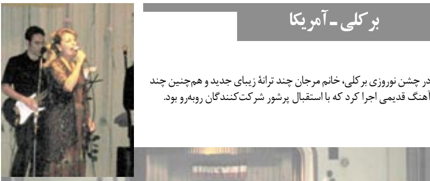
برکلی - آمریکا