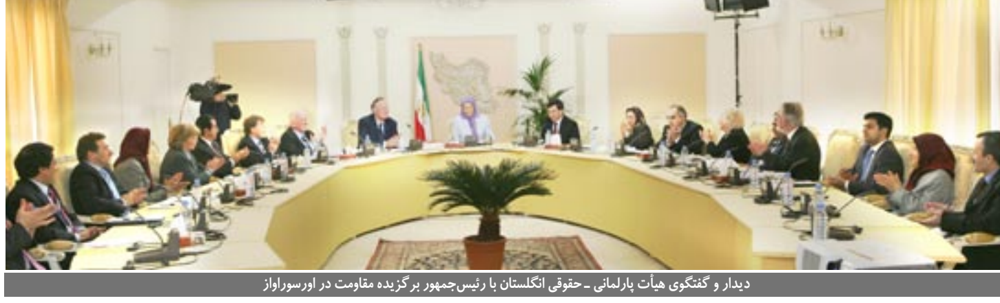
دیدار و گفتگوی هیأت پارلمانی - حقوقی انگلستان با رئیس‌جمهور برگزیده مقاومت در اورسوراواژ

اول اسفند - کنفرانس بزرگ مطبوعاتی در پارلمان اروپا در اعتراض به حضور متکی، وزیر خارجه جنایتکار رژیم، توسط گروه پارلمانی دوستان ایران آزاد و با حضور نایب‌رئیس پارلمان اروپا برگزار گردید ۳ اسفند - به ابتکار کمیته پارلمانی دوستان ایران آزاد در پارلمان اروپا، جلسه‌یی در همبستگی با مقاومت ایران تحت‌عنوان «احمدی‌نژاد و راه‌حلهای اروپا» در مقر این پارلمان در بروکسل برگزار گردید. در این جلسه که با ریاست مشترک پائولو کاساکا نماینده پارلمان اروپا از پرتغال و استروان استونسون، نایب رئیس گروه دموکرات مسیحی پارلمان برگزار گردید، تونه کلا، نماینده پارلمان اروپا از استونی و عضو هیأت‌رئیسه گروه دموکرات مسیحی - محافظه‌کار، اوابریت سونسون، نایب‌رئیس کمیسیون زنان پارلمان اروپا از سوئد، کارین رستاریس، نماینده اتریشی پارلمان از گروه لیبرال، موگتر کامره نایب‌رئیس گروه اتحاد اروپا برای ملتها یو.ای.ان، نماینده دانمارک، دکتر آندره بری، عضو کمیسیون خارجی پارلمان از گروه اتلاف چپ، اریک مایر، نماینده هلندی پارلمان اروپا، آلویسیاس ساکالاس، نماینده پارلمان از گروه سوسیالیست، یاروسلاو زورینی، نماینده پارلمان اروپا از جمهوری چک، از گروه دموکرات مسیحی - محافظه‌کار، پیائورا کاپویی، نماینده فنلاندی پارلمان اروپا و رئیس فاکسیون این کشور در گروه دموکرات مسیحی - محافظه‌کار، آن فریبا، نماینده فرانسوی از گروه سوسیالیست، سخنرانی کردند ۳ اسفند - گرامیداشت یاد و خاطره مجاهد شهید حجت زمانی در گردهمایی ایرانیان و فرانسویان در پاریس ۲ و ۳ اسفند - تجمع هموطنان برای