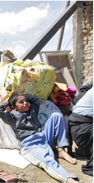
زلزله زدگان استان لرستان با کمبودموادغذایی، دارو و چادر و سایر امکانات ابتدایی مواجه هستند

جرج بوش، در رابطه با این اجلاس گفت: «کاندولیزا رایس در سفر خود به اروپا، به همراه عضو دائمی شورای امنیت و آلمان، یک استراتژی را مشخص کرد تا بتوان براساس آن پیام واحدی به رژیم ایران فرستاد. پیام این است، جهان خواست شما منی بر داشتن سلاح هسته‌یی راد می‌کند. ما روی این هدف که رژیم ایران نباید به سلاح هسته‌یی دست یابد، توافق داریم. اکنون سؤال این است که برای رسیدن به این هدف چگونه همکاری کنیم. کاندولیزا رایس وزیر خارجه و متحدان ما به طور مستمر تلاش می‌کنند که رژیم ایران تفهیم کنند که اگر نمی‌خواهد متزوی شود، باید به دقت از خواسته ما تبعیت کند.»