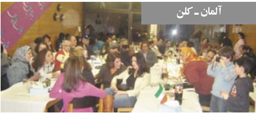
آلمان - کلمن

در مراسم نوروزی تورنتو، خانم سوزان کادیس نماینده پارلمان از حزب لیبرال به سخنرانی پرداخت و ضمن تبریک نوروز برای همه ایرانیان آرزوی دستیابی به دموکراسی نمود. سپس آقای بریان ویلفرت از حزب لیبرال سخنرانی ایراد کرد و آرزوی سالی پر بار و عاری از نقض حقوق بشر برای ایرانیان نمود. خانم یاسمین راتانسی نماینده پارلمان از حزب لیبرال نیز به سخنرانی پرداخت و با برشمردن ویژگیهای نوروز برای همه ایرانیان آرزوی سالی پر بار نمود. خانم راتانسی تأکید کرد: ما تلاش می‌کنیم تا حقوق بشر و دموکراسی به ایران بازگردد.