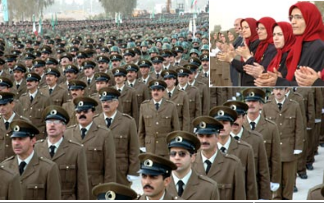
بزرگداشت شهیدان یکصدسال مبارزات مردم ایران در سالروز انقلاب ضدسلطنتی در اشرف