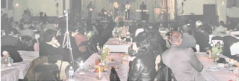
هوستون - آمریکا

در این برنامه تعدادی از دوستان و حامیان مقاومت در هوستون، از جمله نماینده الگترین از حزب دموکرات، سناتور کبیرلی هاجینسون، نماینده سیلا جکسون لی، نماینده تد پو، نماینده ایالتی آقای ترنر و هم‌چنین آقای ج ام خان و خانم سو دیوید از شورای شهر هوستون، با حضور یافتند و با فرستادن پیام تبریکهای خود را به جامعه ایرانیان و مقاومت ایران ابراز داشتند. در جشن هوستون هم آقای منوچهر سخایی ترانه‌های زیبا و خاطره انگیزی را اجرا نمود که بسیار مورد توجه حاضران قرار گرفت.