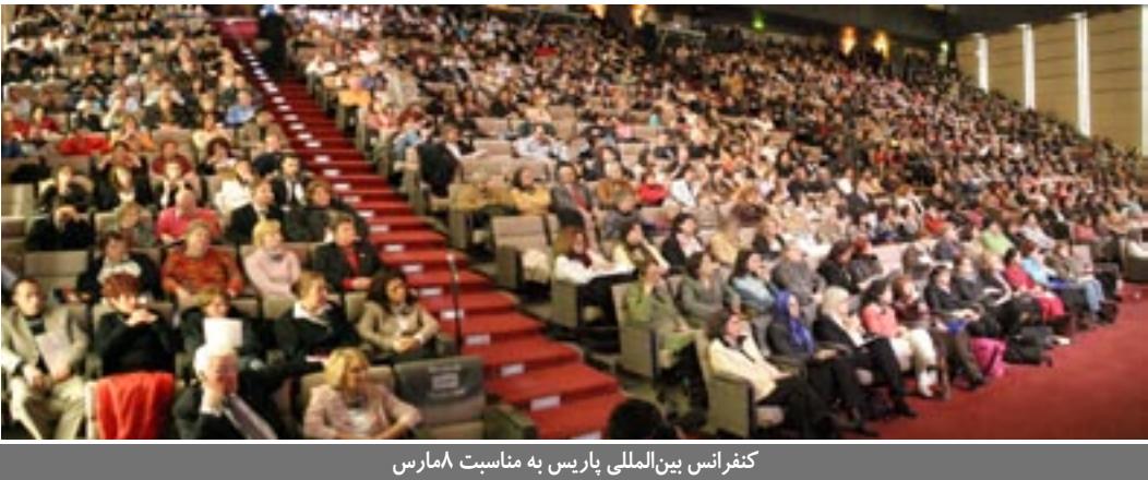
کنفرانس بین‌المللی پاریس به مناسبت ۸مارس