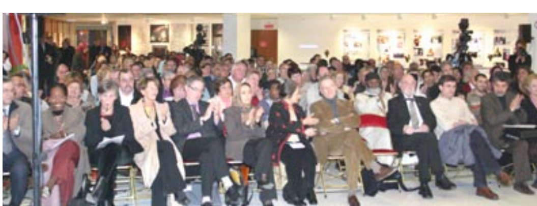
نمایشگاه «ربع قرن جنایت و سرکوب ملایان» در شمال پاریس