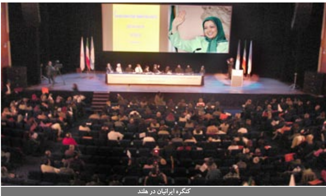
کنگره ایرانیان در هلند

حمایت از اعتصاب قهرمانانه کارکان شرکت واحد در اتاوا و تورتو (کانادا) استکهلم (سوئد) ۱۲ بهمن - ایرانیان در تظاهراتی مقابل پارلمان هلند در لاهه خواستار بررسی مجدد لیست تروریستی و حذف نام مجاهدین از این لیست شدند ۱۲ بهمن - بحث پارلمانی در جلسه رسمی مجلس عوام انگلستان پیرامون تهدیدات اتمی رژیم آخوندی و ضرورت حذف نام مجاهدین از لیست تروریستی ۱۳ بهمن - تظاهرات ایرانیان در برابر آژانس بین‌المللی انرژی اتمی در وین برای ارجاع پرونده اتمی آخوندها به شورای امنیت ملل متحد ۱۴ بهمن - در سمیناری در کلوب خبرنگاران واشینگتن و فراخوان آنها به خروج نام سازمان مجاهدین خلق ایران از لیست تروریستی، پیوسته بودند، اعلام کردند بقیه در صفحه ۱۱