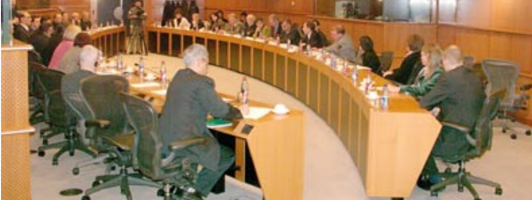
جلسه کمیته پارلمانی دوستان ایران از سازمان مجاهدین خلق ایران در پارلمان اروپا