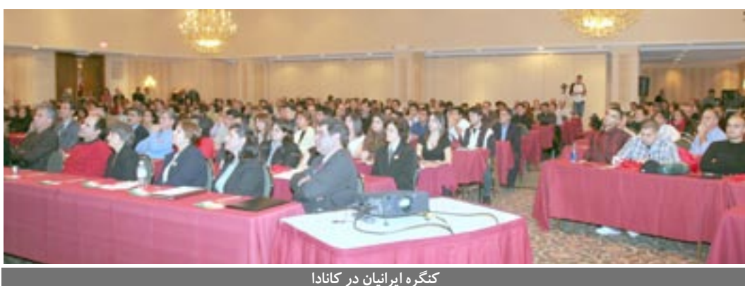
کنگره ایرانیان در کانادا