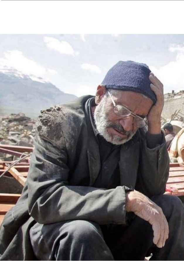
زلزله زدگان استان لرستان با کمبودموادغذایی، دارو و چادر و سایر امکانات ابتدایی مواجه هستند

شهر سامرا خبر دادند، در که حالی که قنهاس در شهر سامرا در عراق شیعیان و سنیهادر کمال برادری در کنار هم زندگی می‌کنند، رژیم آخوندی برای راه‌اندازی جنگ فرقه‌یی و آشوب در عراق از طرح شیعه کردن این شهر خبر داد. از سوی دیگر روزنامه السیاسه چاپ کویت، از طرح گسترده رژیم آخوندی و عوامل آن در عراق برای تسلط بر مرکز و جنوب این کشور خبر داد و بزرگترین جداسازی جمعیتی در اوایل قرن بیست و یکم را افشا کرد. عدنان الدیمی، اطلاعاتی و امنیتی پارک ملت و هدف شیعی کردن بغداد خبر داد که توسط عوامل رژیم آخوندی در بغداد صورت می‌گیرد. برای مطالعه اخبار مداخلات رژیم آخوندی در عراق، به صفحه ۶ همین شماره نشریه مراجعه کنید