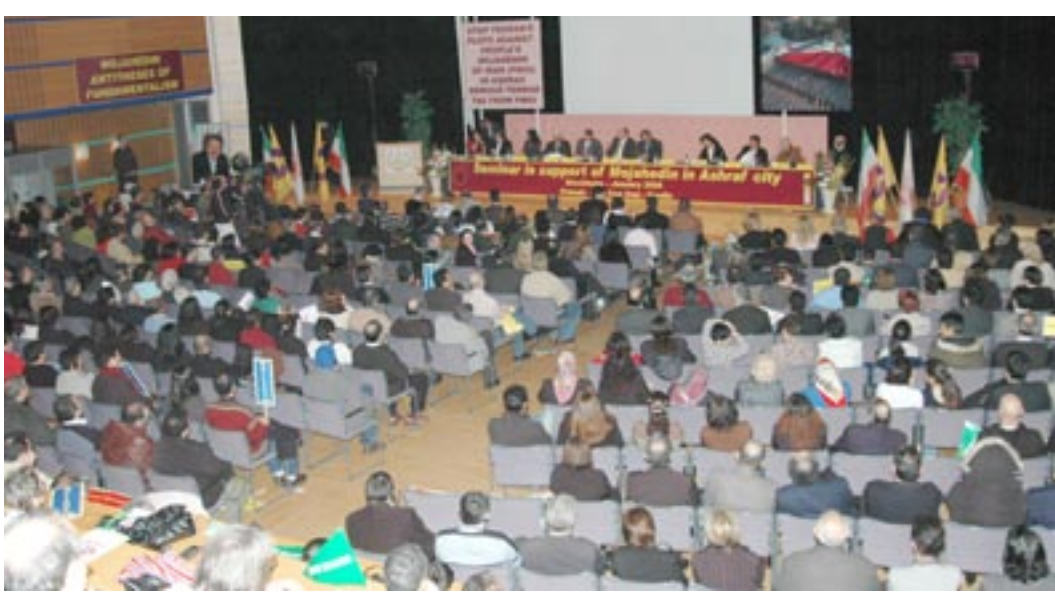
کنگره دفاع از مجاهدین شهر اشرف در استکهلم