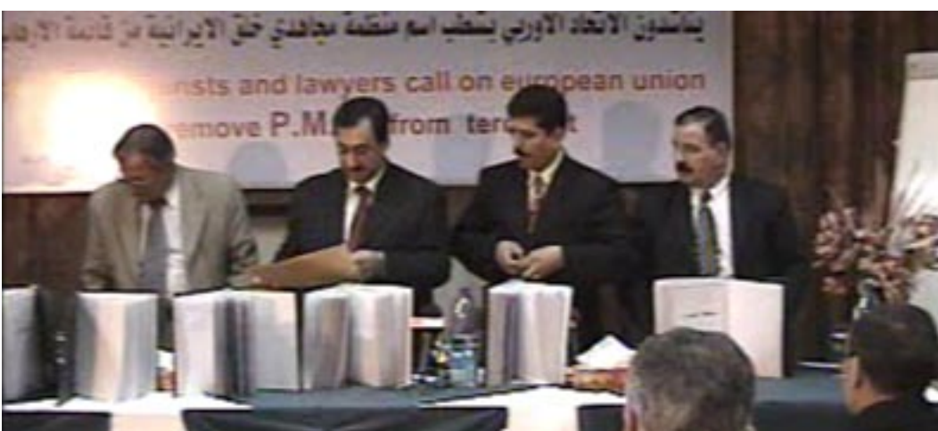
اعلام بیانیه ۱۲۰۰ حقوقدان و وکیل عراقی برای حذف نام مجاهدین از لیست تروریستی در کنفرانسی از سوی جمعیت حقوقدانان مستقل