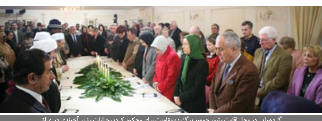
گردهمایی در محل اقامت رئیس‌جمهور برگزیده مقاومت برای محکوم کردن جنایات رژیم آخوندی در عراق