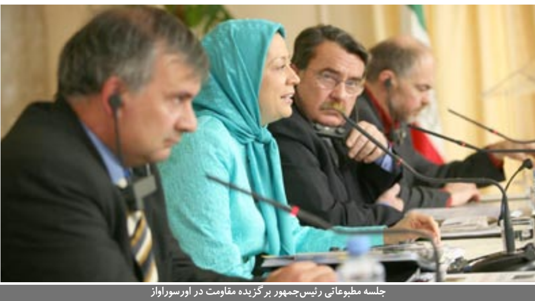
جلسه مطبوعاتی رئیس‌جمهور برگزیده مقاومت در اورسوراواژ