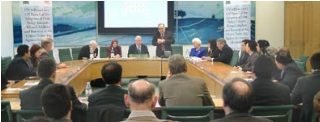
اعلام فراخوان ۴۰۵ نماینده مجلسین انگلستان برای حذف نام مجاهدین از لیست تروریستی و حمایت از مریم رجوی در پارلمان انگلستان