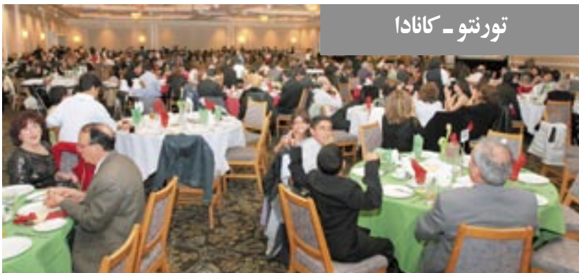
تورنتو - کانادا

در مراسم نوروزی تورنتو، خانم سوزان کادیس نماینده پارلمان از حزب لیبرال به سخنرانی پرداخت و ضمن تبریک نوروز برای همه ایرانیان آرزوی دستیابی به دموکراسی نمود. سپس آقای بریان ویلفرت از حزب لیبرال سخنرانی ایراد کرد و آرزوی سالی پر بار و عاری از نقض حقوق بشر برای ایرانیان نمود. خانم یاسمین راتانسی نماینده پارلمان از حزب لیبرال نیز به سخنرانی پرداخت و با برشمردن ویژگیهای نوروز برای همه ایرانیان آرزوی سالی پر بار نمود. خانم راتانسی تأکید کرد: ما تلاش می‌کنیم تا حقوق بشر و دموکراسی به ایران بازگردد.