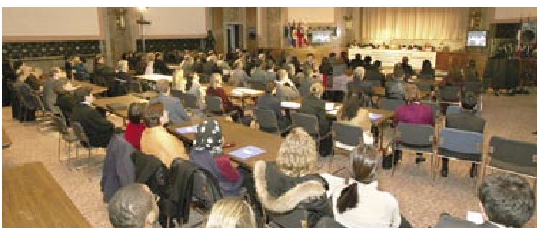
سمینار بزرگ در سنای آمریکا علیه تهدیدات بنیادگرایی در ایران و عراق