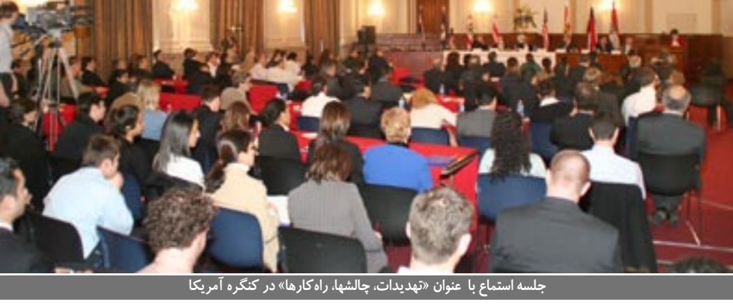
جلسه استماع با عنوان «تهدیدات، چالشها، راه‌کارها» در کنگره آمریکا