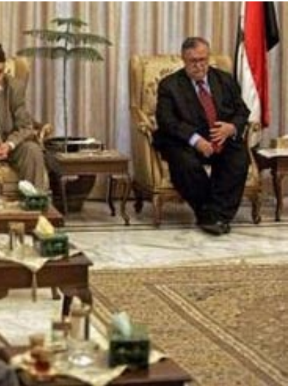
سران فراکسیون‌های سیاسی عراق در مورد ترکیب شورای امنیت ملی عراق به توافق رسیدند

این روزنامه در ادامه اضافه می‌کند: «منابع دولتی و سیاسی عراق و هم‌چنین از گانه‌های اطلاعاتی آمریکا، انگلیس و آلمان از حدود پنج ماه پیش تا کنون تأکید می‌کنند که کوچک‌دادن جمعی و سازمان‌یافته یهودیان از مناطق سنی از بغداد تا مرز سوریه در غرب و تمارز اقلیم کردستان در شمال و مشخصاً مناطق اطراف کر کوک و اسکان دادن آنها در مناطق مشخص شده در شکاف‌های سنی‌نشین اطراف بغداد به طور گسترده ادامه دارد. این