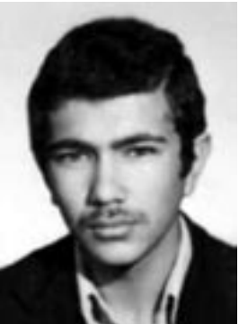
مجاهد شهید علی حاجی‌نژاد