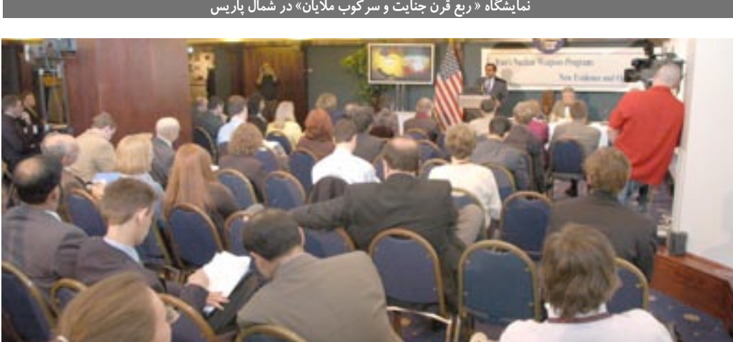
کنفرانس افشاگرانه در واشینگتن در مورد طرح‌های اتمی رژیم و آماده کردن ۵ هزار ساتریفوز در طنز