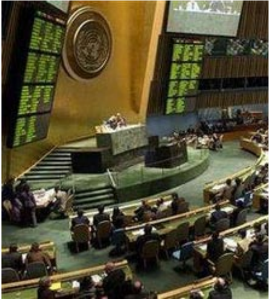
تاج رأی‌گیری اجلاس مجمع عمومی در تابلو اجلاس نمایش داده می‌شود

روزنامه نیویورک تایمز نوشت: «این مذاکرات نشان می‌دهد که چین به‌طور فزاینده‌ای به یک قدرت جهانی تبدیل شده است».