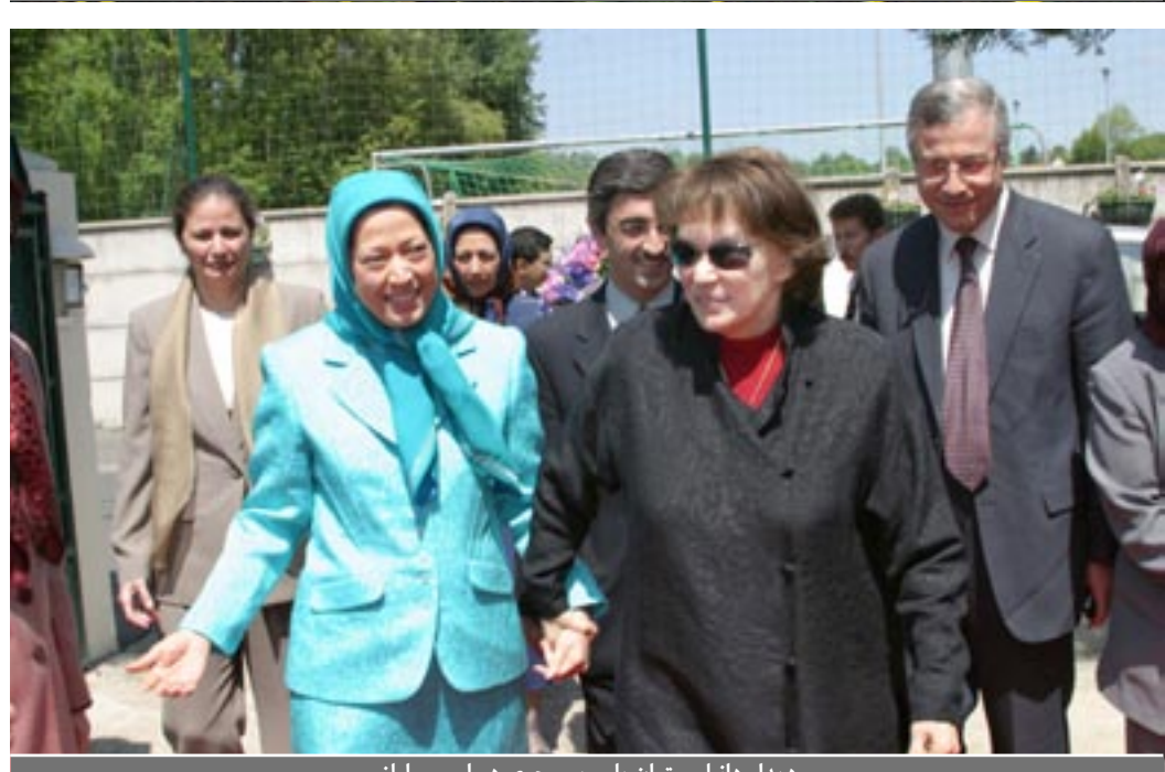
دیدار دانیل میتران با مریم رجوی در اورسوراواژ