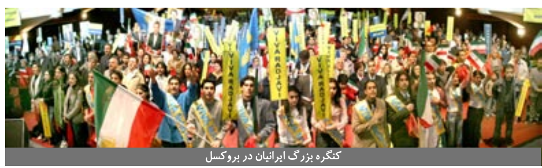
کنگره بزرگ ایرانیان در بروکسل