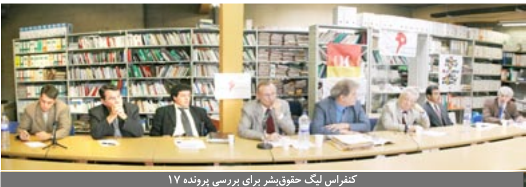
کنفرانس لیگ حقوق بشر برای بررسی پرونده ۱۷