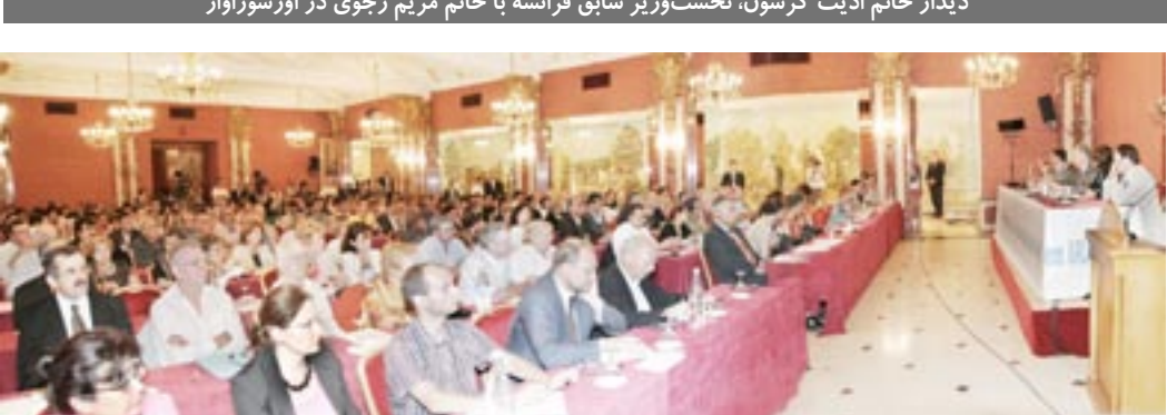
سمینار «بیامدهای انتخابات در ایران» در پاریس