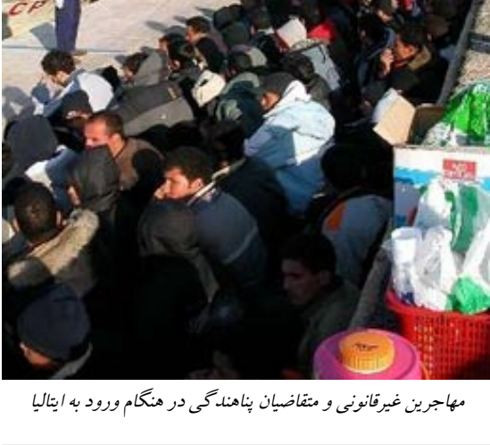
مهاجرین غیرقانونی و متقاضیان پناهندگی در هنگام ورود به ایتالیا

این شورا دریک سال دست کم سه بار تشکیل جلسه خواهد داد که مجموع روزهای جلساتش به ۱۰ هفته می‌رسد، بنابراین برگز اری جلسات این شورا نسبت به ارگان قبلی بسیار بیشترمی‌باشد. علاوه بر آن هرگاه یک عضو این شورا مرتکب نقض شدید حقوق بشر شود عضویت آن دراین شورا به تعلیق درمی‌آید.