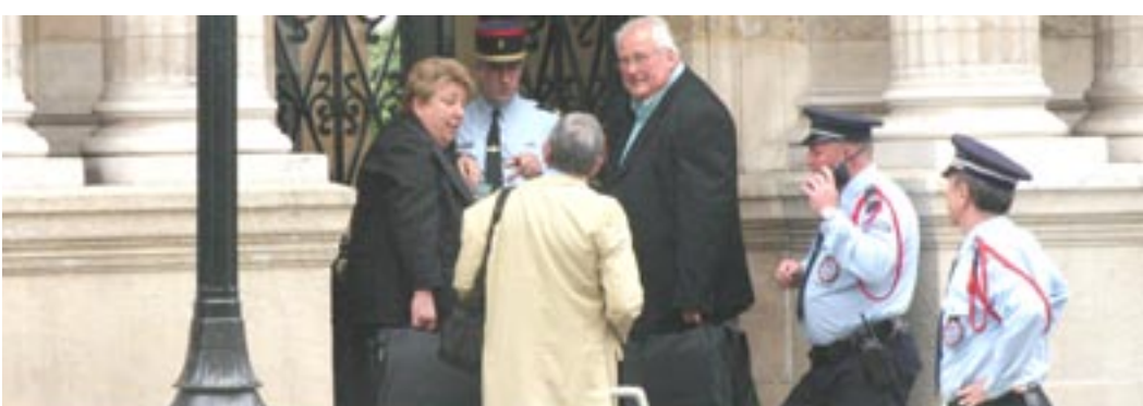
یک هیأت فرانسوی بیانیه و امضای ۱۰۰ هزار شهروند فرانسوی در حمایت از رئیس‌جمهور برگزیده مقاومت ایران را به کاخ الیزه تحویل داد