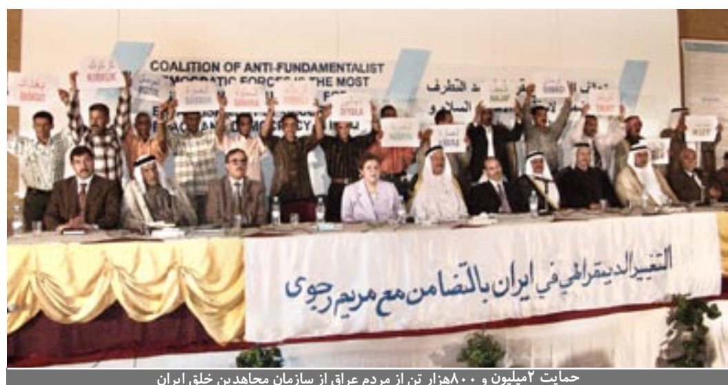
حمایت ۲ میلیون و ۸۰۰ هزار تن از مردم عراق از سازمان مجاهدین خلق ایران