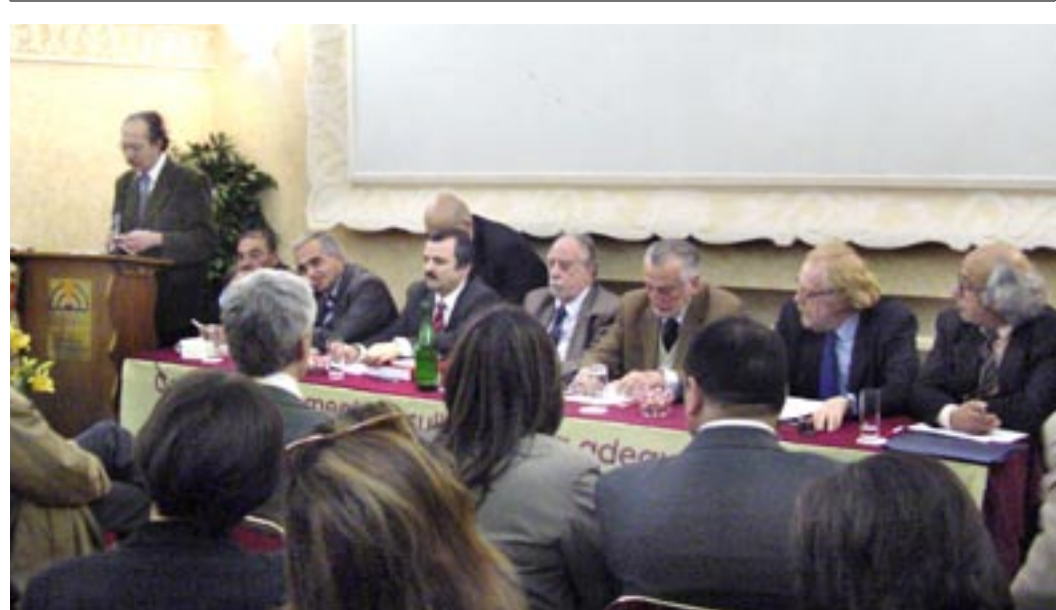
حمایت قانونگذاران ایتالیایی از راه‌حل سوم مریم رجوی برای تغییر دموکراتیک در ایران

پارلمان بلژیک و نایب‌نخست‌وزیر سابق این کشور و پیتیر گیلگس، دبیر بین‌المللی حزب دموکرات مسیحی بلژیک در اورسوراواژ فروردین - افشای غنی‌سازی اورانیوم در یک سایت مخفی رژیم ۸ فروردین - دیدار رئیس‌جمهور برگزیده مقاومت از کلیسای ژوسر در شمال پاریس ۹ فروردین - دیدار رئیس‌جمهور برگزیده مقاومت با دیوید ایمنس نماینده مجلس عوام انگلستان ۱۱ فروردین - افشای تلاش رژیم برای دستیابی به پلوتونیوم در کنفرانس مطبوعاتی شورای ملی مقاومت در پاریس ۱۳ فروردین - دیدار شخصیت‌های استان والدواژ فرانسه، شهرداران شهرهای اور و یامون با رئیس‌جمهور مقاومت ۱۶ فروردین - تظاهرات هزاران ایرانی در میدان باستیل پاریس علیه حضور خاتمی در فرانسه. در این تظاهرات ستانور ژان پیر میشل، عضو سنای فرانسه، ایو بونه، رئیس سابقه سازمان ضد تروریستی فرانسه؛ اسقف ژاک گایو، مدافع حقوق بشر؛ ایو ژان گالاس از رهبری جنبش صلح؛ مولود آتوینیت، دبیر کل جنبش ضد تروریستی و برای دوستی خلفا (م‌آب)؛ پیر برسی، رئیس حقوق بشر نوین و برخی از مسئولین و اعضای شورای ملی مقاومت ایران سخنرانی کردند. ۱۷ فروردین - تجمع هواداران مقاومت در سیدنی استرالیا در همبستگی با تظاهر کنندگان در پاریس علیه سفر