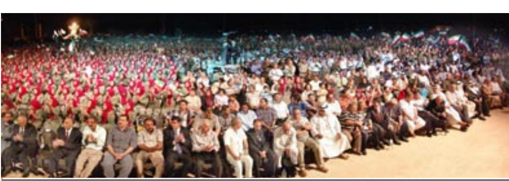
۳۰ خرداد و دومین سالگرد ۱۷ ژوئن در اشرف