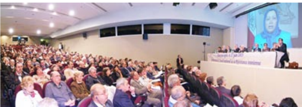
کنفرانس بزرگ حقوقدانان در پاریس ۲ سال پس از ۱۷ ژوئن