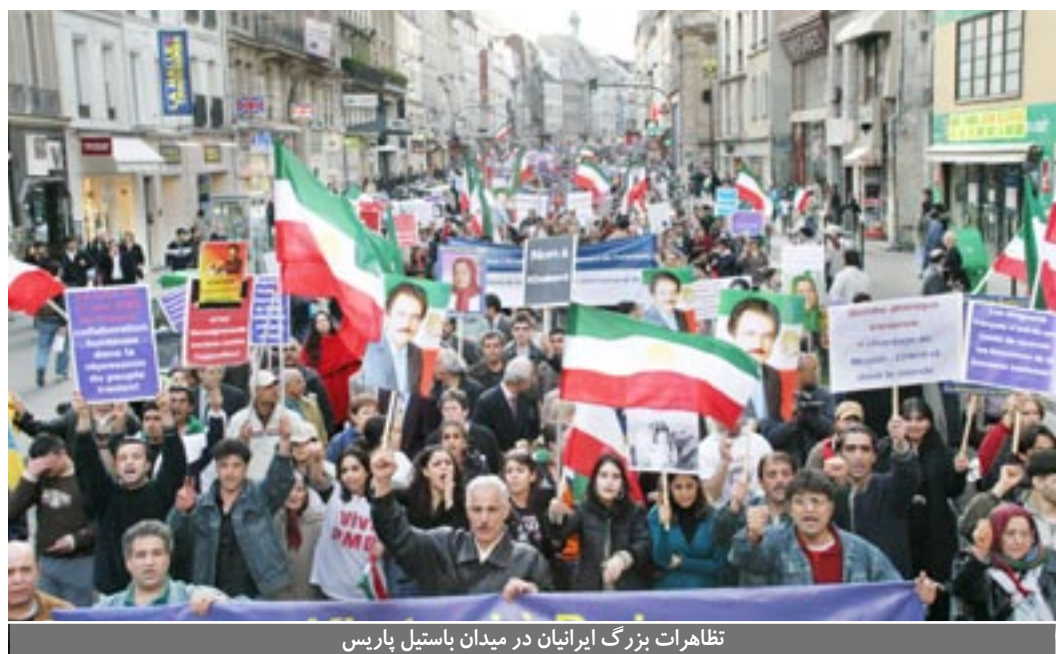
تظاهرات بزرگ ایرانیان در میدان باستیل پاریس

اول فروردین - مراسم سال تحویل و جشن نوروزی ۸۴ با حضور مریم رجوی، رئیس‌جمهور برگزیده مقاومت در شمال پاریس برگزار شد. هم‌چنین جشنهای نوروزی ایرانیان در شهرهای مختلف کشورهای اروپایی و آمریکا و کانادا برگزار گردید. اول فروردین - بزرگداشت خاطره ابراهیم ذاکری، سردار قهرمان ارتش آزادی بر سر مزارش در پراشلز پاریس ۲ فروردین - بیش از ۵۰۰ تن از شخصیت‌های سیاسی و حقوقی انگلستان با شرکت در یک سمپوزیوم بزرگ در چرچ هاوز، راهبای خارج کردن نام سازمان مجاهدین خلق ایران از لیست تروریستی را مورد بررسی قرار دادند. ۳ فروردین - جشن نوروزی در همبستگی با مقاومت ایران در پارلمان انگلستان و کنگره آمریکا ۴ فروردین - دیدار رئیس‌جمهور برگزیده مقاومت با هرمان وان رومبوی، نماینده