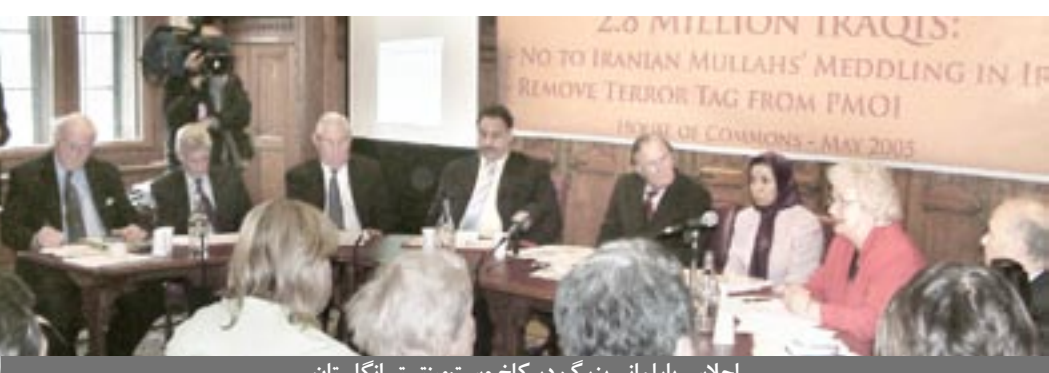
اجلاس پارلمانی بزرگ در کاخ وست‌مینستر انگلستان