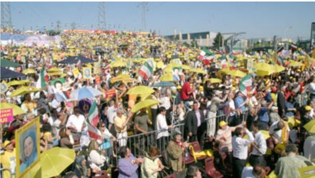
کوشه‌یی از بزرگترین اجتماع ایرانیان در فرانسه به مناسبت دومین سالگرد ۱۷ ژوئن

اول تیر - جلسه بحث و گفتگو در مورد مسائل ایران در پارلمان فدرال استرالیا اول تیر - کنفرانس مطبوعاتی کمیته سیاست ایران در مورد گزارش دیدبان حقوق بشر در باشگاه ملی مطبوعات آمریکا ۳ تیر - تجمع اعتراضی هواداران مقاومت در حمایت از تحریم انتخابات آخوندی در لندن ۳ تیر - در پی فراخوان سازمان مجاهدین خلق ایران، هزاران تن از مردم تهران در مقابل دانشگاه تهران تجمع اعتراضی برگزار کردند ۵ تیر - گردهمایی مردم عراق در اشرف به مناسبت پیروزی بزرگ مقاومت و مردم ایران در تحریم یکپارچه شعبه انتخابات رژیم آخوندی ۸ تیر - کنفرانس مطبوعاتی «کمیته دفاع از حقوق بشر» در مونترال در باره نقض