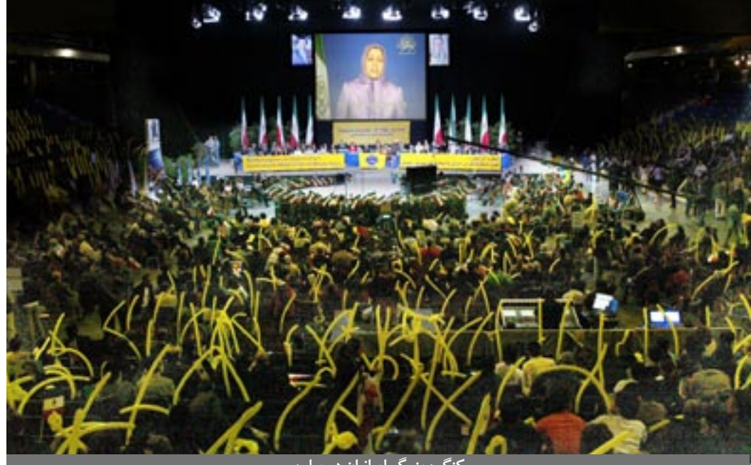
کنگره بزرگ ایرانیان در برلین