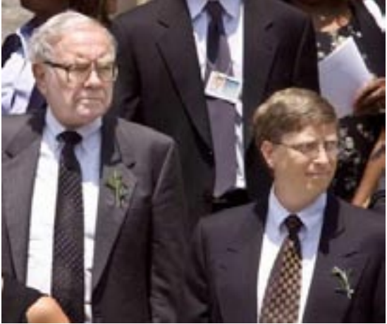
بیل گیتس(راست)، برای دوازدهمین سال متوالی نروتمندترین فرد در جهان شد وارن بافت(چپ) ۲۶میلیارد دلار دومین نروتمند جهان شناخته شد