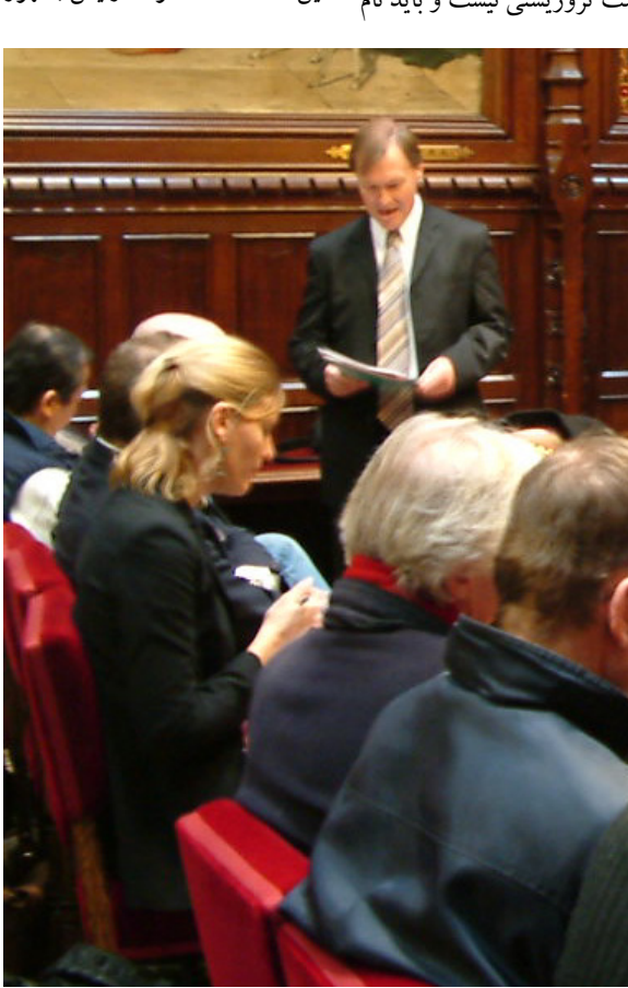
لرد کوریت در مورد مجاهدین گفت که آنها

من معتقدم که سیاست استمالت بسیار بدتر از سیاست تشویق است، غریبه نرفته سیاست استمالت را پیش می برند بلکه اعمال شنیع ملاها را تشویق می کنند. من معتقدم که این سیاست در مقابل مجاهدین خلق ایران تصور مثل قطع اعضای بدن، سنگسار مردم ایران هر روز وخیمتر می شود. ما باید حق مردم ایران برای مقاومت در مقابل ستم را به رسمیت بشناسیم این پایه ای ترین اصل حقوق بشر است. دموکراسی در ایران قابل دسترسی است اما باید به مردم ایران امکانات برای دسترسی به این هدف داده شود. رئیس جمهور