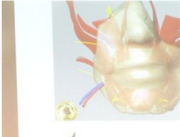
تیم جراحان به اولین بررسی نتایج عمل جراحی می‌پردازد