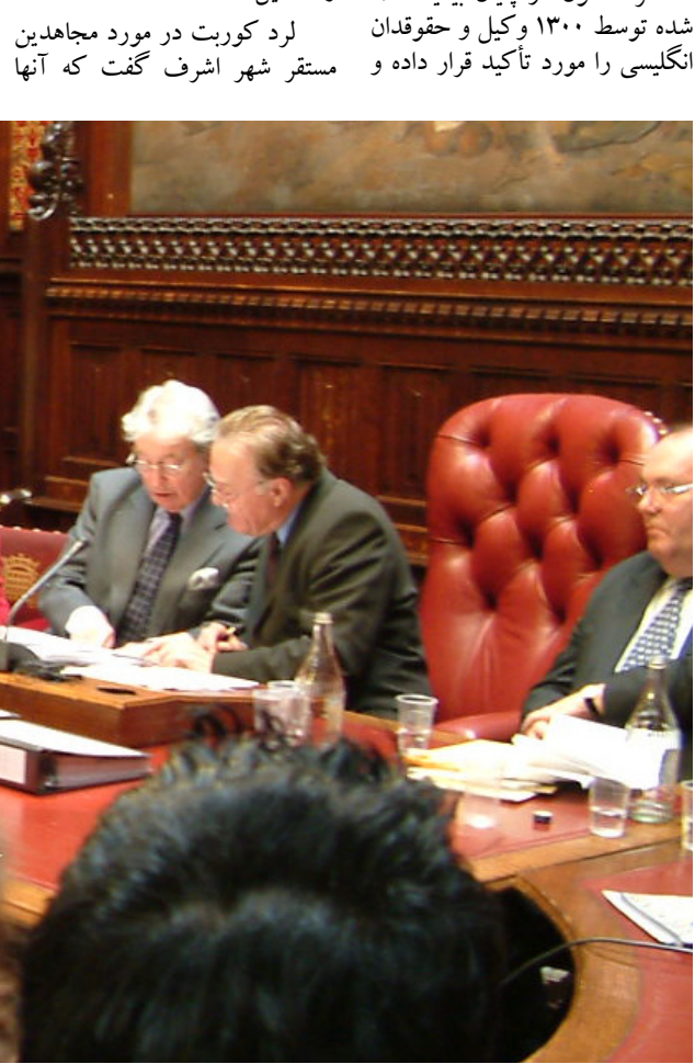
لرد کوریت در مورد مجاهدین گفت که آنها

لرد آلتون در پایان بیانیه امضا شده توسط ۱۳۰۰ وکیل و حقوقدان انگلیسی را مورد تأکید قرار داده و مستقر شهر اشرف گفت که آنها