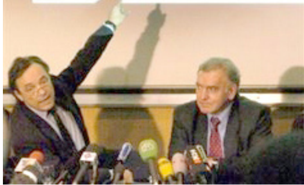
عمل جراحی به سرپرستی پروفیسور برنارد دواشل و پروفیسور ژان میشل دورنارد صورت گرفت

غذا را از دست داده بود، برای حرف زدن با دشواری زیادی روبرو بود و امکان آن نبود که با جراحی پلاستیک عضلات اطراف دهان که به فرد امکان می‌دهد هنگام سخن گفتن قادر به ادای درست کلمات باشد و هنگام تاول، غذا از دهانش بیرون نریزد ترمیم شود. وی گفت پیوندن‌دن اعصاب باید به بیمار امکان دهد در ناحیه صورت تحرک داشته باشد. گفته آنها چهار ساعت پس از عمل خون در بافت‌های تلاش شد.