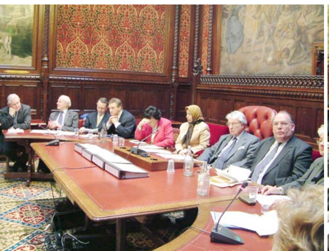
لرد کوریت، رئیس کمیته پارلمانی بریتانیا برای آزادی از رژیم ملایان دانست و ادامه نگاهداشتن نام سازمان مجاهدین خلق ایران در لیست سازمانهای ممنوعه را نادیده گرفتن حق مشروع مردم ایران برای مقاومت در برابر سرکوب و اختناق خواند

از دولت انگلستان خواست هر چه سریعتر سازمان مجاهدین را از لیست سازمانهای ممنوعه خارج سازد.