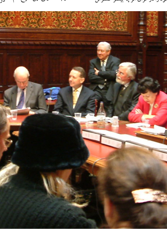
لرد کوریت در مورد مجاهدین گفت که آنها

ما به طور مستمر در مراسم مختلف فراخوان داده ایم که تا زمانی که دموکراسی و آزادی در ایران تحقق نیابد، از فعالیتهايمان در دفاع از مقاومت و مردم ایران کوتاه نخواهیم آمد. رژیم ایران همواره به دنبال صدور بنیادگرایی داخلی رژیم ایران در عراق مهر تایید می زند. این واقعیتها مسأله دو وزارت کشور عراق در اوت گذشته بوده شدند، مورد توجه قرار می دهد. به رغم آن که نیروهای چند ملیتی این آدم ربايي را محکوم کردند ولی تلاشها برای پیدا کردن آنها به نتیجه نرسیده است.