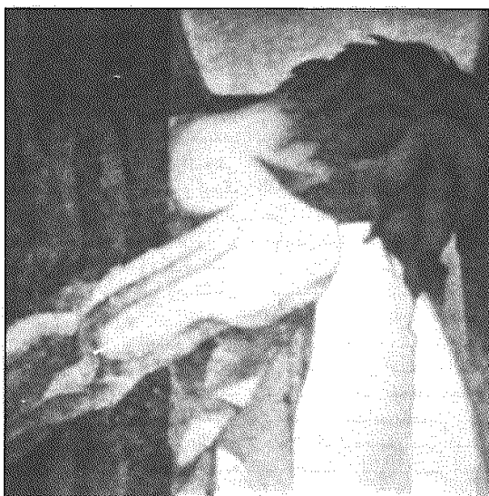
شکجه: طرحی از "پاولو گامارگو" شاعر و طراح برزیلی

که در عین حال هم برای آزادی، استقلال و عدالت و یگانگی اجتماعی با رژیم خمینی مبارزه می‌کند، و هم از شرکت آکتیو طبقات خلقی - به استثناء کردستان - در تشکیلات شورا محروم مانده‌اند. شورائی که اساسا بی‌بایستی مجموعه‌ی دیالکتیکی