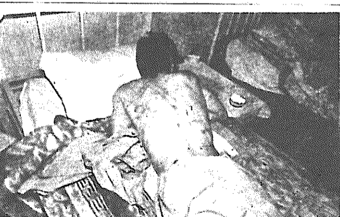
آثار چماق و چماق داری: این شیوه‌ی کتف آریامهری، سند رسواکننده‌ی ارتجاع بر بیسگر مردم

روزنامه “مجاهد” نشریه مجاهدین خلق ایران سال اول آدرس: تهران ۱۶ صندوق پستی شماره ۶۴/۱۵۵۱