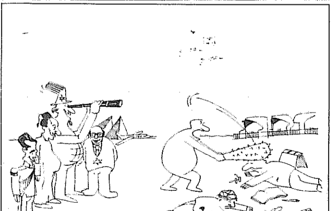
آثار چماق و چماق داری: این شیوه‌ی کتف آریامهری، سند رسواکننده‌ی ارتجاع بر بیسگر مردم