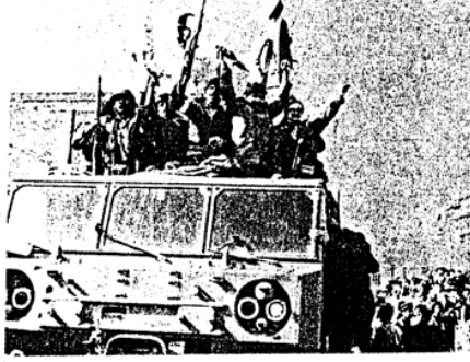
برادران مجاهد موسی خیابانی و ... همگام با خلق در تسخیر پادشاهی تشرییز

پیروزی انقلاب را در شرایطی جشن می گیریم که مچ مرتجعین و لیبرالها باز شده است و پیمان عصر عوام فریبی فرار سید هاست "ان من مخرت لکالیوم غا نین یقته من المظالم حیزته الکثوف غن تخم الکثبات" ۵۷ می گذرد. سالی که در آن تحوالات هر روز سرعت و شتاب بیشتری می یافت. آنچنان سرعتی که پایان شکوه مند خلق در بهمن ماه ۵۷ می گذرد. سالی که در آن تحوالات هر روز سرعت و شتاب بیشتری می یافت. آنچنان سرعتی که بقیه در صفحه ۸