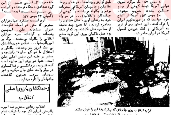
ارابه انقلاب روی جاده ای که بپیکر شهدا آن را فرست میکنند جلو میروند به "مذاکرات" سازندگان!

حرکات و عملیات فیرآمیزی که علیه امپریالیزم جهانپنوا صورت میگردد خود گواه بار شاد جدید بود امپریالیستی جنبش خلق است: ۲۸ مهر ۵۷ کارکنان وزارت دارائی، ضمن اعتصاب خود خواستار خروج کامل مستشاران خارجی و تحریم مبادلات بازرگانی ایران با اسرائیل و آفریقای جنوبی میشوند. دوم آبان ۵۷ دو هزار کامیوندار ارمنجانی خواستار اخراج رانندگان خارجی میشوند. ۱۴ آبان ۵۷: کارکنان تاسیس اجتماعی، امریکائیکها (حدود ۴ نفر) را از محل کار خود بیرون میکنند. ۲۲ آبان ۵۷: کارکنان شرکت اخبارات تهران، کارکنان امریکائیک این شرکت را بیرون میکنند. ۳۰ آذر ۵۷: یک مستشار امریکائیک در جنوب کشور کشته میشود. ۴ دی ۵۷: در دغانیات با اعتراض به اینکه چرا به چهارم سگار صرفی در ایران از امریکائیک تأمین میشود در حالی که توتون کاران امریکائیک بیکار مانده اند، دست به اعتصاب میزنند. ۶ دی ۵۷ کارکنان هواپیمایی کشور طی اعتصاب خود اعلام میکنند که از نشستن هواپیمای امریکائیک و اسرائیلی جلوگیری خواهند کرد. ۱۰ دی ۵۷: خلق تهران مشدند و جنبش ایران و امریکائیک، انجمن ایران و انگلیس و منزل چند مستشار امریکائیک را به ویرانی میکنند. ۲۶ دی ۵۷: آرتور دیلیو هاین هات - رئیس ستاد مستشاری امریکائیک در تهران در تشریحی واقع در نیواور بعد از سخنرانی (اطلاعات ۲۶ دیماه ۵۷) ۲۹ دی ۵۷: لاری میونس سرگرد امریکائیک در غایل خانه های در فرمانیه به گلوله بسته میشود (اطلاعات ۲۹ دیماه ۵۷) در همین روز فرزندان امپریالیست خان جنگلی در ننگرود بیچم آمریکا کشته میشوند. ۵ بهمن ۵۷: کارکنان هلی کوپتر - وزارت ایران وابسته به صنایع نظامی از ترک جیب سبد به اعتصاب کرده و خواستار اخراج کارکنان امریکائیک شدند.