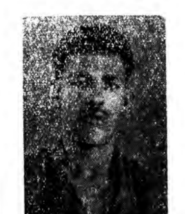
مردان باند بهلوی دریای خروشان

ما این پیروزی درخشان را که تضمین کننده پیروزی های بعدی این کارگران است بجهه کارگران تبریک میگوئیم و بار دیگر متذکر میشویم که اتحادشما و تشکل منطقی شماست که می تواند کارفرمایان زورگور را بشلیم وادارد