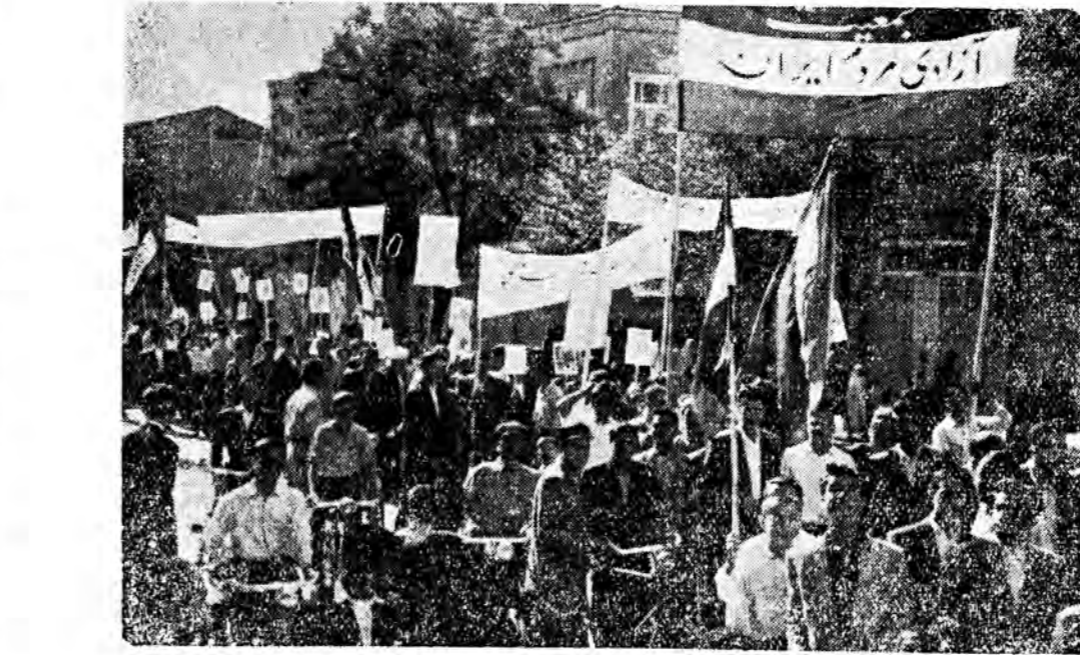
مردم قهرمان مشهد براهبری جمعیت ماهزادها رای بانحلال مجلس هفدهم داد همین آراء قاطع بود که کاخ ترغونی در بار منظور را بکناره و از کون کرد

از هنگامی که در ایران خدایرستی جای خود را بشاه پرستی داد و بجای توحید و عدل پول و سر نیزه حاکم بر مردم شد هیئت ثابتی از انسان نماهای درنده خو و در حقیقت بوزینگان و کرکندهای بی شاخ و دم بلا واسطه مزدوری استعمار کران را کردن گرفته تمام هستی ملت ایران را مصرف و بالخت کردن مردم ایران حکومت و فرهنگ این کشور خراب شده راد دست گرفتند و دین و مذهب را برای زور - بقیه در صفحه ۴