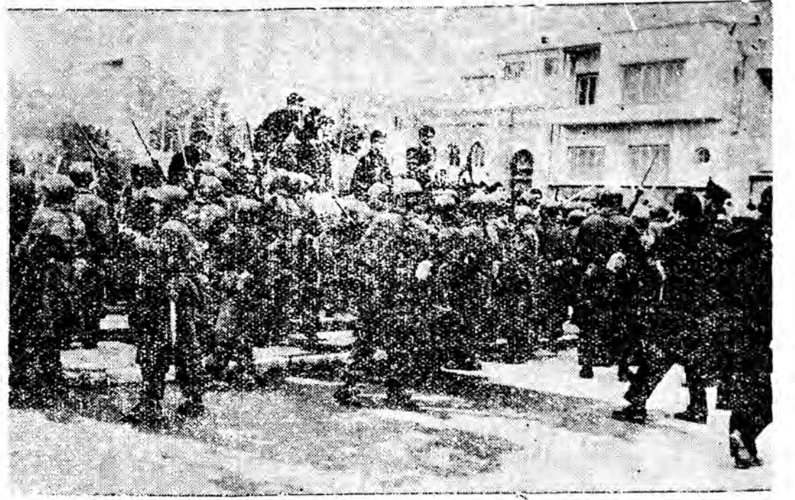
سربازان فرمان فرمانده کل قوا «شاه» شکر ۳۰ تیر سال گذشته اینگونه فرزندان مات را شهید میکردند