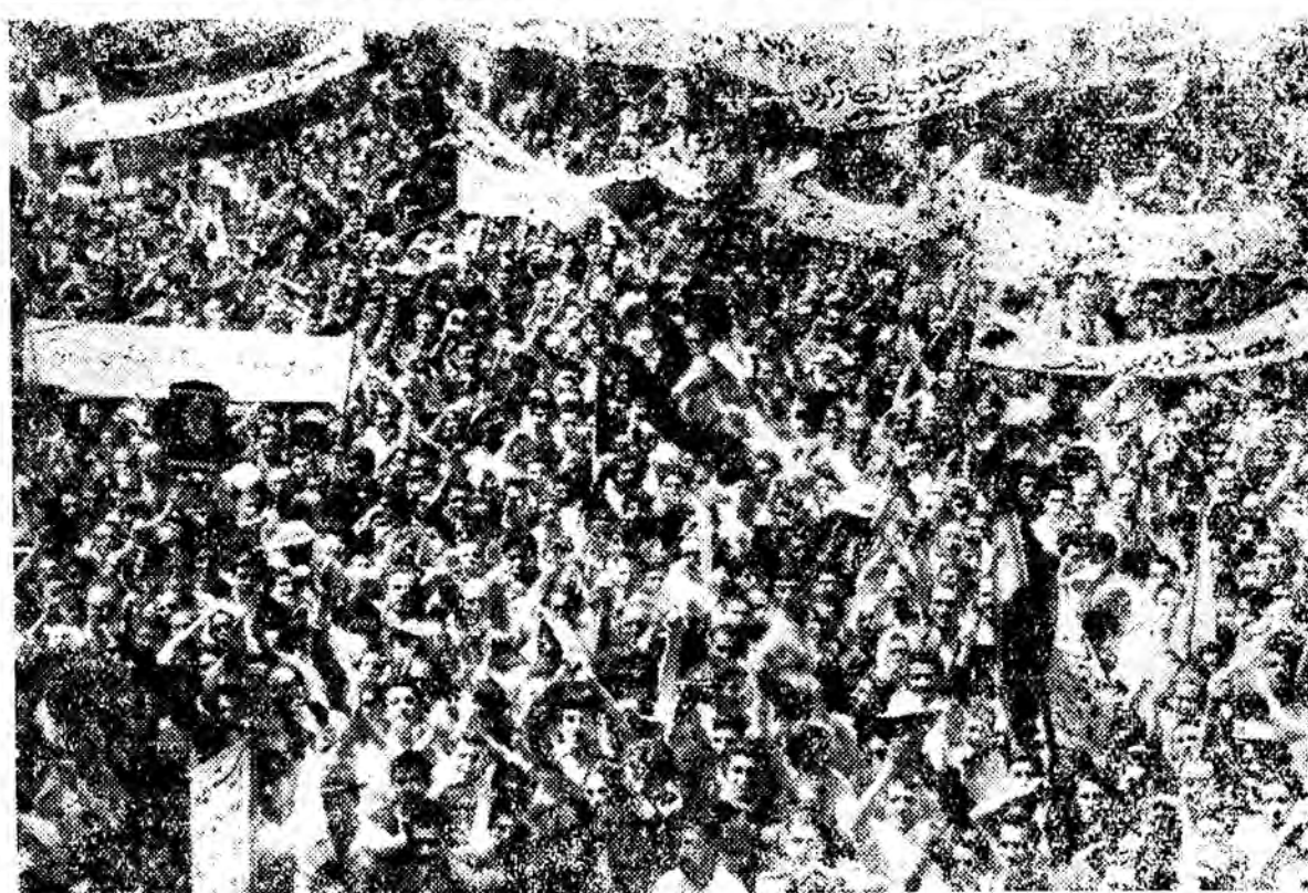
صحنه ای از تظاهرات باشکوه مردم مبارز تهران در میتینگ ۲۹ خرداد آبا بازم «شاهد نویسان» کور می گویند اینها عده ای چاقو کش دولتی هستند

ساعت یک ربع، ۹ اتوبوس حامل نمایندگان جمعیت آزادی مردم ایران شهرستان قزوین در مقابل جمعیت ایستاد و رفقای که در باشگاه جمعیت بودند